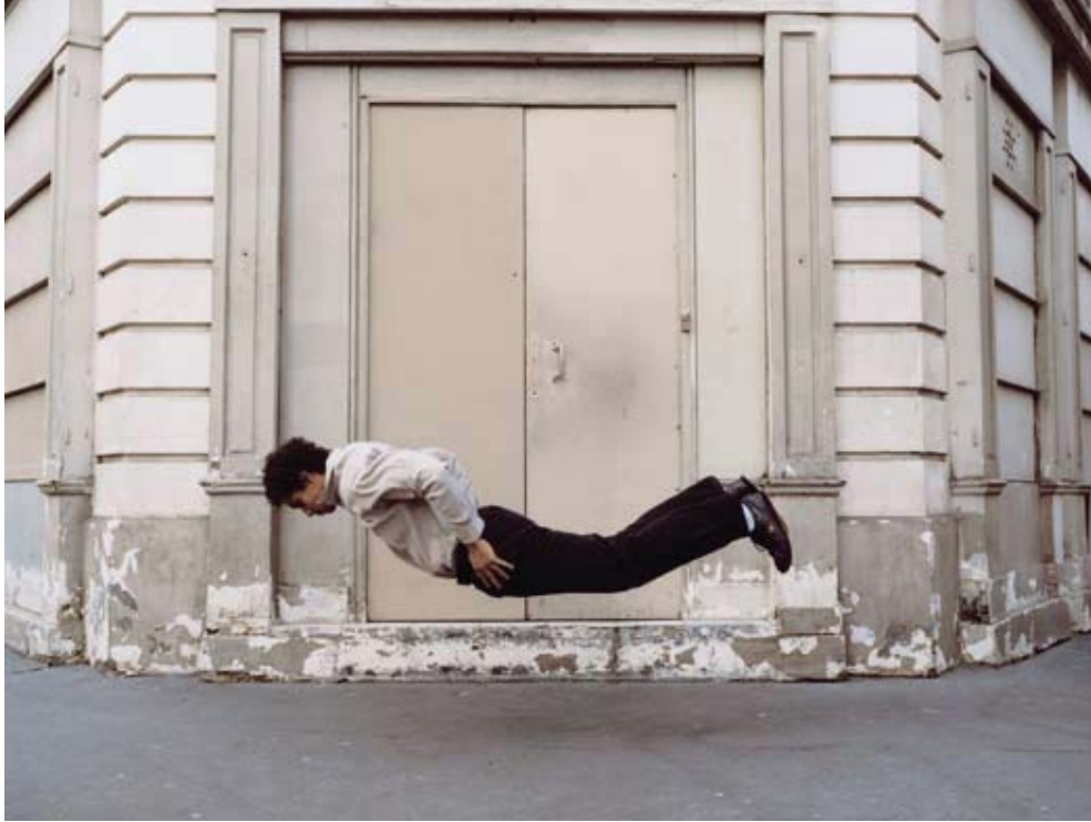
Denis Darzacq - La Chute