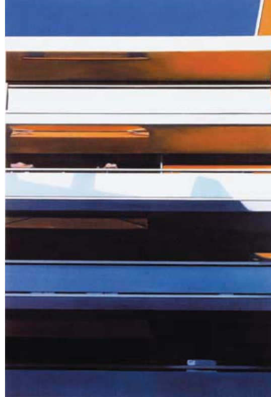
Eberhard Havekost - Stuhl