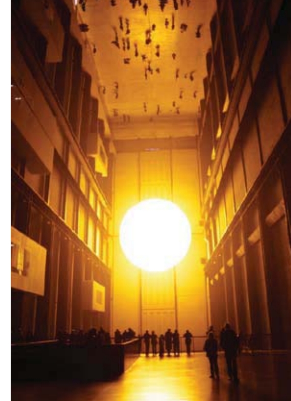
Olafur Eliasson - The Weather Project

Voor de theorie van de Kunsten geldt dat er ook in de professionele disciplines sprake is van multidisciplinariteit en interdisciplinariteit: grenzen van de theoretische Kunstdisciplines lijken nauwelijks meer afgebakend te kunnen worden door een alsmat uitbreidende stroom aan nieuwe invloeden vanuit film, fotografie, mode, reclame, psychologie, filosofie, enzovoorts. In de theoretische Kunst en Cultuurwetenschappen zijn in de afgelopen jaren debatten gevoerd over wat de belangrijkste onderwerpen en methodes in het hedendaagse kunst en cultuurhistorische onderzoek zouden moeten zijn. Kritische theorieën hebben de ontwikkeling van kunstgeschiedenis, theaterwetenschappen, filmwetenschappen bepaald, waardoor het accent verlegd is van een mono-disciplinaire benadering naar een veel bredere benadering, waarbij kunst beschouwd wordt in relatie tot de culturele context en waarbij interdisciplinariteit en interculturaliteit centraal staan. Het blikveld is verbreed vanuit de westerse cultuur naar de wereldcultuur. Hybriditeit als concept is vanuit het postkoloniale denken doorgedrongen tot de productie van Kunst waarin het nu bepalend is voor artistieke, creatieve processen. 3 Gardner noemt een van de Five minds, the synthesizing mind , waarbij ideeën uit verschillende disciplines tot een nieuw coherent geheel samengevoegd worden. Dit sluit aan bij deze ontwikkelingen van hybriditeit.