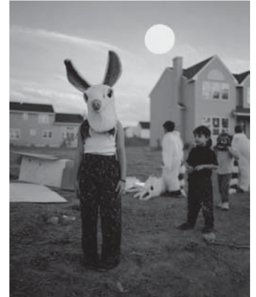
Pierre Huyghe - Still uit Streamside Day Follies