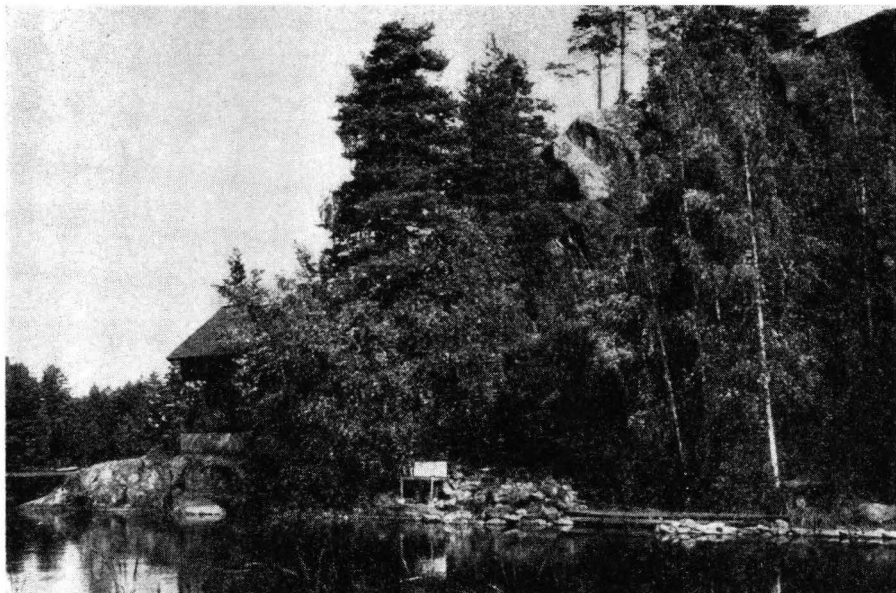
Fig. 2. Juusjärvi, Kyrkslätt. Målningen är bakom den på bilden synliga byggnaden.

Målningen finns på öststrandens klippvägg, som är lätt utåtlutande, uppskattningsvis c:a 5 m över Juusjärvis yta (30.8 m ö.h.). Klippan är granit och dess harnesk hårda yta är bemålad med figurer i rött: åtminstone fem mänskofigurer, en hand (tydligt gjord så, att en med rödfärg nedsölad handflata har tryckts mot bergväggen), en fisk och en lång, ormliknande otydlig figur. Målningens hela höjd är c:a 2 m och bredden c:a 1.5 m. Det är möjligt att flere figurer kommer att hittas, när bergväggen undersöks minutiöst.