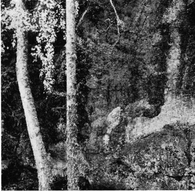
Fig. 3. Juusjärvi, Kyrkslätt. Klippvägg med målningar.

55 cm långa. Hjulbensmaneret är således tydligt äldre än vinkelbensmaneret på denna målning, men ålderskillnaden behöver inte vara stor.