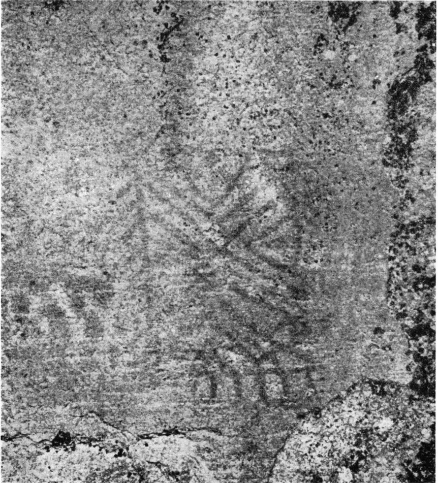
Fig. 6. Hällmålningen vid Vitträsk.

metriskta figurer tillsammans med mänsko- och djurbilder. Också i den paleolitiska bildkonsten förekommer geometriska och naturalistiska bilder sida vid sida.