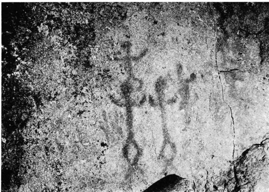
Fig. 4. Juusjärvi, Kyrkslätt. Detalj av målningen.

målningarna figurer som är likadana som Juusjärvi-målningen. I Telemark i Sydnorge finns en målning med åtminstone fem människofigurer. De är delvis fragmentariska, men åtminstone några är hjulbenta, medan några förefaller att vara gjorda i vinkelbensmaner. Händerna fattar om höfterna, symmetriskt med benen, och är alltså annorlunda än på Juusjärvibilderna, vars armar är vågräta och något uppåtböjda. De norska bilderna är c:a 30 cm höga. 2 Också i Mellan-Norge, på ön Leka i Nord-Trøndelag, finns en rödmålad människofigur i hjulbensmaner. 3 Också dess händer är symmetriska med benen.