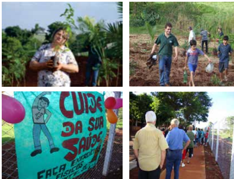
Figura 5 – Ações de educação ambiental e educação em saúde.