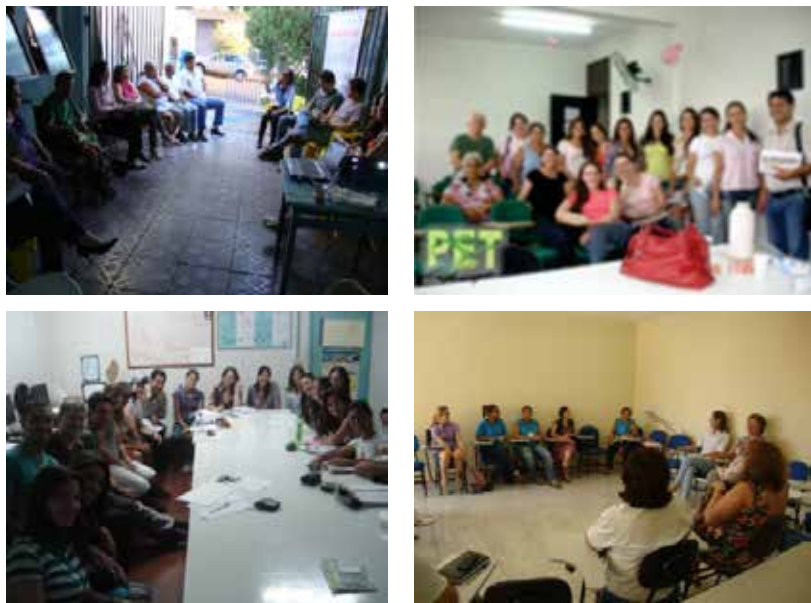
Figura 4 – Reuniões com a comunidade local: associação de moradores, conselho local de saúde, unidade básica de saúde e escola local, respectivamente.