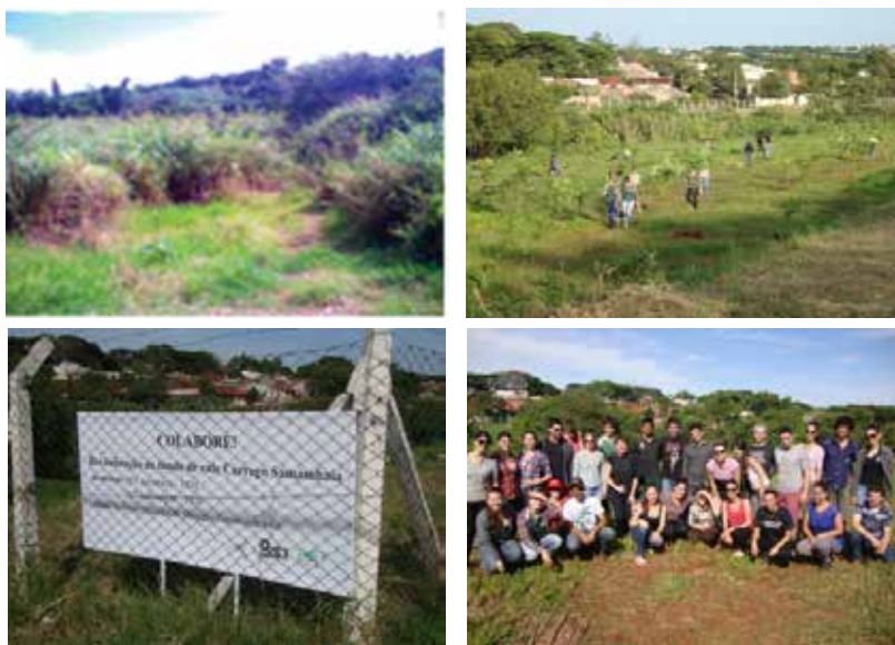
Figura 3 – A área de fundo de vale antes e após o plantio e a equipe atual do projeto.