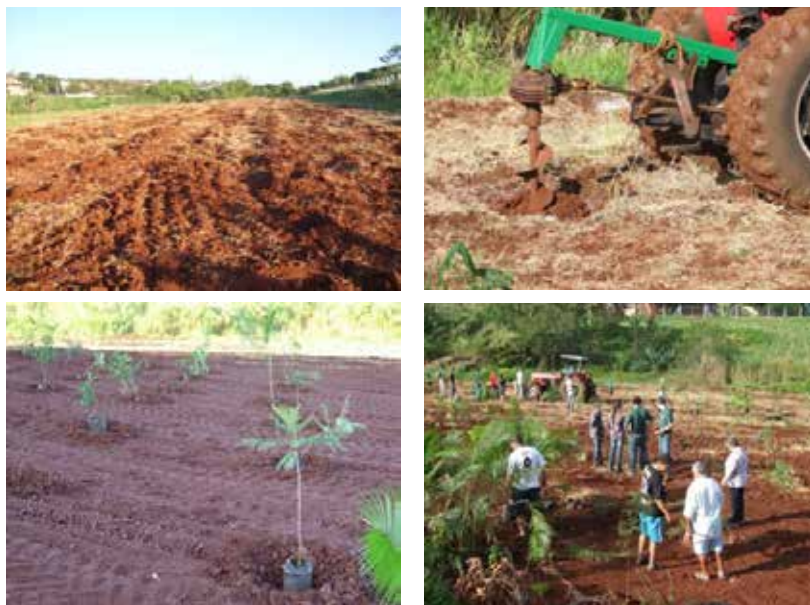
Figura 2 – Etapas de plantio na área do fundo de vale.