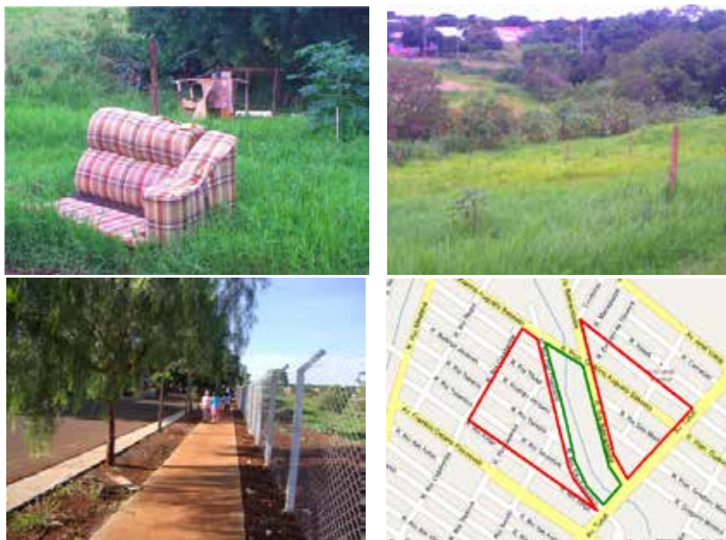
Figura 1 – A área de fundo de vale antes e depois do cercamento. Localização da área.

medida que possibilitou um espaço para caminhadas e atividades grupais, até então ausente na região, conforme verificado na figura 1.