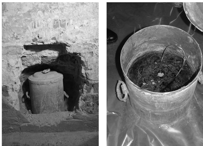
a b Ryc. 5.