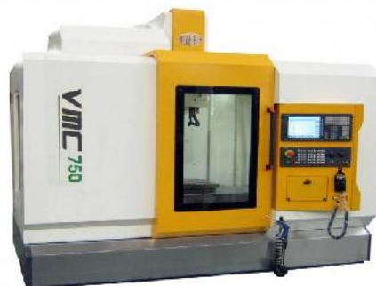
Gambar 1. VMC 750