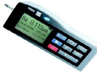
Gambar 2. Surface Tester