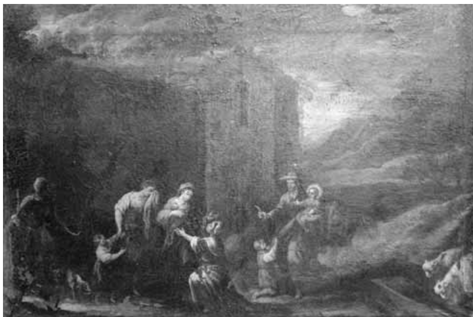
Foto 8. La Despedida al partir para Egipto. Brea de Aragón (Zaragoza), iglesia parroquial de Santa Ana.