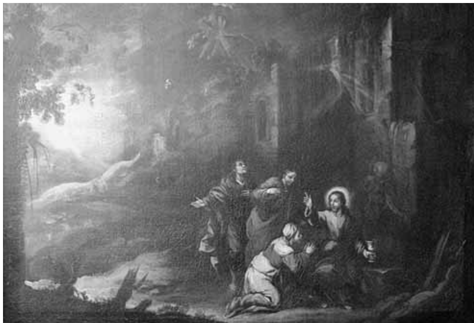
Foto 3. La madre de los hijos de Zebedeo ante Cristo. Huesca, Palacio Episcopal.