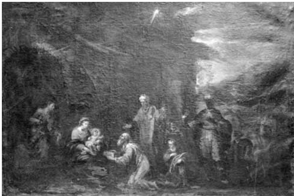
Foto 7. La Adoración de los Magos. Brea de Aragón (Zaragoza), iglesia parroquial de Santa Ana.