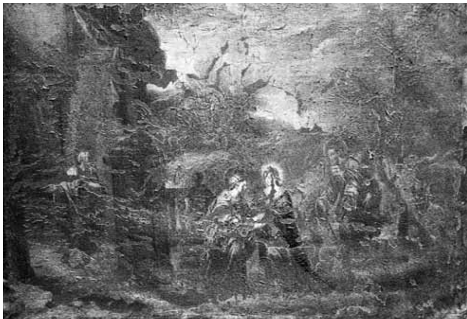
Foto 5. La Visitación. Brea de Aragón (Zaragoza), iglesia parroquial de Santa Ana.