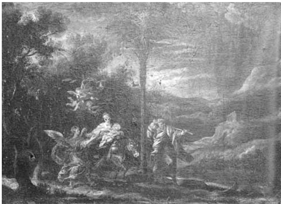
Foto 10. La Huida a Egipto. Brea de Aragón (Zaragoza) , iglesia parroquial de Santa Ana.