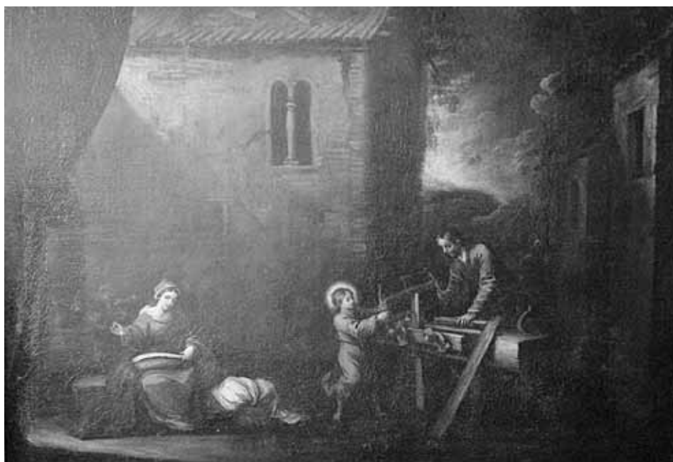
Foto 2. El taller de Nazaret. Huesca, Palacio Episcopal.