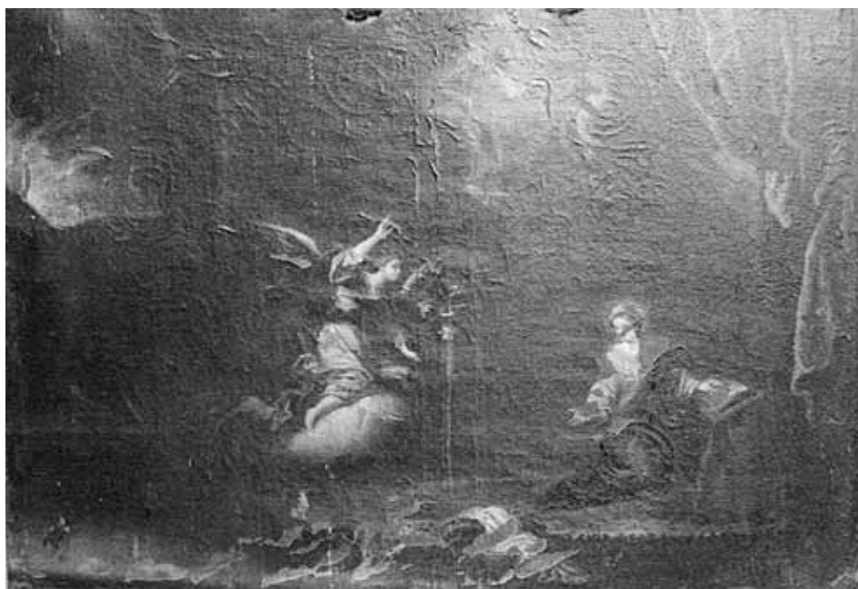
Foto 4. La Anunciación. Brea de Aragón (Zaragoza), iglesia parroquial de Santa Ana.