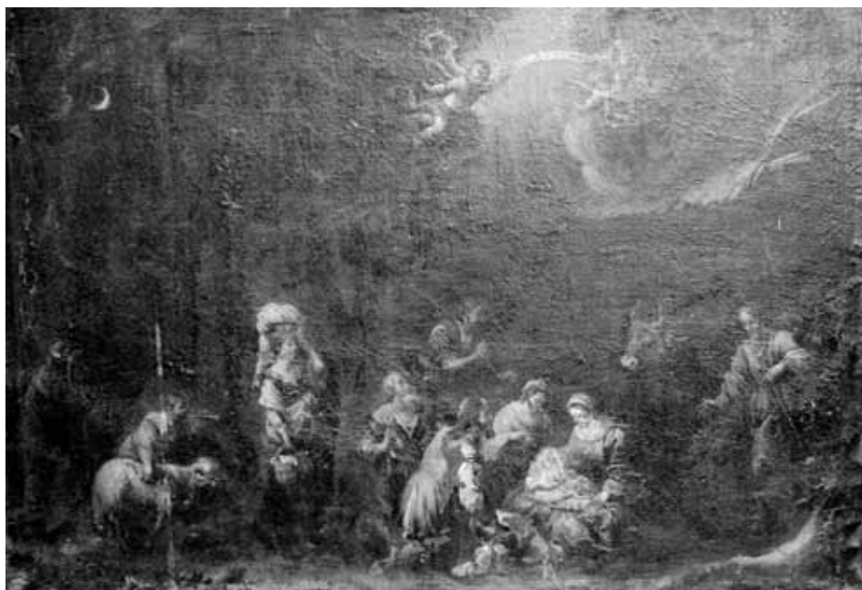
Foto 6. La Adoración de los Pastores. Brea de Aragón (Zaragoza), iglesia parroquial de Santa Ana.