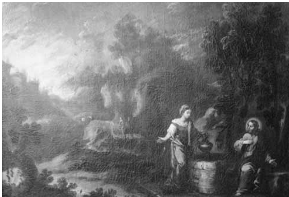
Foto 1. Cristo y la Samaritana. Huesca, Palacio Episcopal. (Fotografías: Juan Carlos Lozano López).