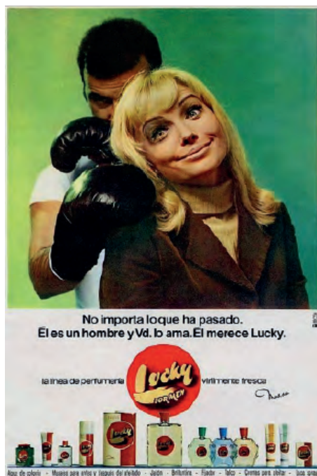
Fig. 11. Campaña publicitaria de perfumerías Lucky, con el lema No importa lo que ha pasado. Él es un hombre y Vd. lo ama. Él merece Lucky, 1968.