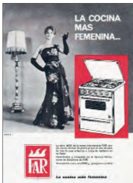
Fig. 10. Campaña publicitaria de cocinas Far, con el lema La cocina más femenina, 1965.

diseño publicitario español. Cuando se legisló en 1988 para retirar toda la publicidad de las carreteras para aumentar la seguridad vial, aunque inicialmente amenazado, finalmente indultado, lo que permite todavía poder encontrarse con casi un centenar de los toros de Prieto, 91 exactamente, por lo ancho de nuestra geografía. 24 Fue un diseño comercial del cartelista Manolo Prieto (1912-1991) realizado en 1956 y es posiblemente la mejor valla publicitaria levantada en nuestro país. 25