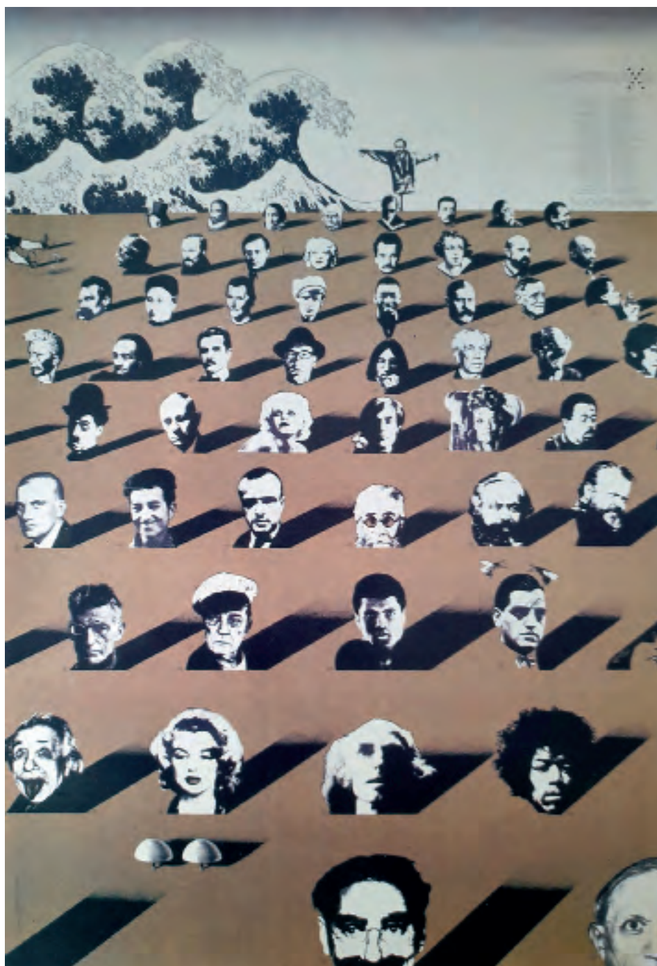
Fig. 8. Enric Satué, cartel Los Heterodoxos de Tusquet, para la editorial Tusquets, 1974.