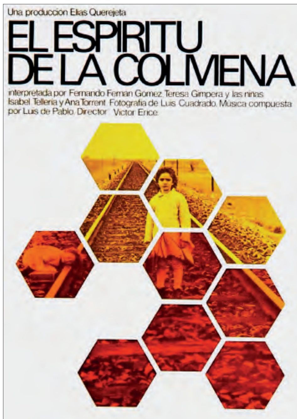
Fig. 1. José María Cruz Novillo, cartel para la película de Víctor Erice El espíritu de la colmena, 1973.