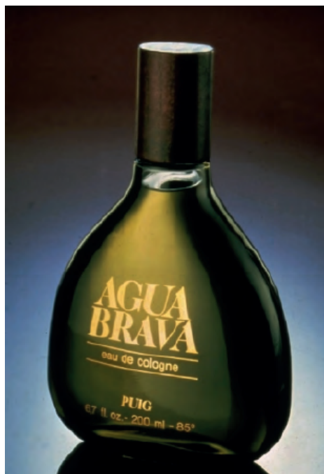
Fig. 12. Envase diseño de André Ricard y tipografía de Yves Zimmermann para Agua Brava, 1968.

En uno una mujer iba a la consulta de una pitonisa buscando consejo por los malos tratos de su marido y la solución propuesta era no escatimar con el Soberano , pues el hombre, que tanto trabaja fuera de casa se merece algo agradable cuando llega al hogar. La línea de perfumería “virilmente fresca” Lucky , presentaba a una mujer maltratada ante un hombre con guantes de boxeo a la que se le decía: No importa lo que ha pasado. Él es un hombre y Vd. lo ama. Él merece Lucky [fig. 11].