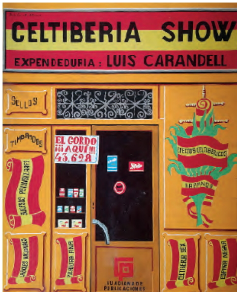
Fig. 4. Alfredo Alcáin, portada para el libro de Luis Carandell, Celtiberia Show , 1970.