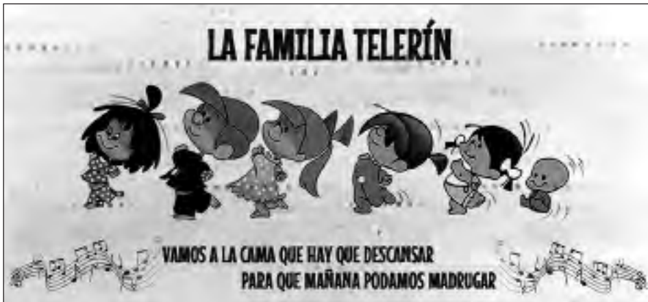
Fig. 6. Estudios Moro para Televisión Española, La familia Telerín, 1964.

muñecas articuladas, ocupaban los primeros puestos en las cartas a los Reyes Magos. La publicidad de la época envolvió la imagen de la infancia en un aspecto tan risueño como las ilustraciones de Juan Ferrándiz (1917-1997), indiscutible maestro del arte de la ilustración infantil de toda una época. Los dibujos animados de José Luis Moro Escalona (1926-2015), autor, además de multitud de anuncios televisivos, de la famosa Familia Telerín, que mandaban cada día a los niños y niñas a la cama, que hay que descansar, para que al día siguiente pudieran madrugar [fig. 6].