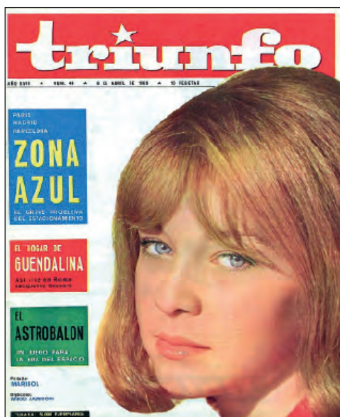
Fig. 9. Marisol en portada del semanario Triunfo, abril de 1963.