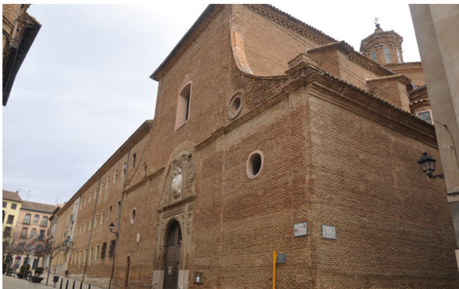
Fig. 5. Fachada de la iglesia del antiguo colegio de la Compañía de Jesús de Tudela, actual parroquia de San Jorge el Real.