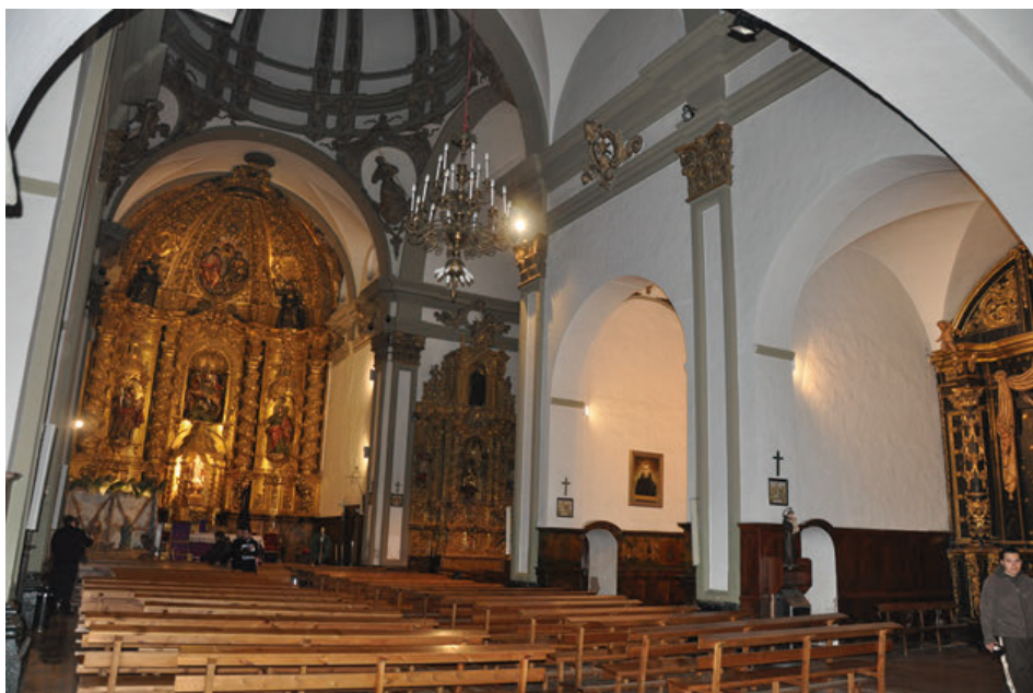
Fig. 3. Interior de la iglesia del antiguo colegio de la Compañía de Jesús de Tudela, actual parroquia de San Jorge el Real.