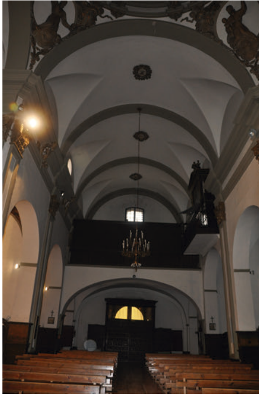
Fig. 14. Coro alto a los pies de la nave de la iglesia del antiguo colegio de la Compañía de Jesús de Tudela, actual parroquia de San Jorge el Real.

Una intervención arquitectónica que también consistió en anular toda comunicación existente entre el claustro y la iglesia aneja al mismo, tanto en las tres puertas correspondientes al crucero del templo, sacristía y la escuela del piso bajo del patio, como las entradas situadas en el segundo y tercer piso del mismo. Finalmente, el maestro tudelano construiría una habitación y cocina para el sacristán adosada a la sacristía, anexa a la cabecera por el lateral de la epístola, comprometiéndose a ejecutar todo el proyecto en el plazo de dos meses y medio, corriendo de su cuenta todos los materiales.