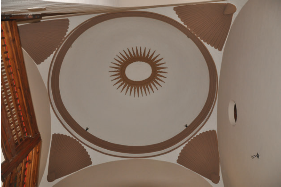
Fig. 13. Detalle de la bóveda de la caja de la escalera del antiguo colegio de la Compañía de Jesús de Tudela, actual Centro Cultural Castel Ruiz.