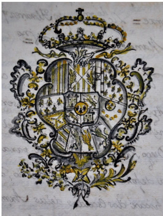
Fig. 4. Diseño del escudo real de Carlos III, dibujado por Diego Resa. Archivo Histórico de Loyola, Colegios, 68/1, f. 108.

era precisa para su ejecución, alabastro blanco, su calidad, altura, ancho y grueso, afirmando que el escudo de las armas reales que van tiradas en el diseño demostrado, con consideracion a disposicion y de los nichos en que se han de poner tiene y deve llevar siete palmos de altura, cinco de ancho y dos de grueso, la piedra donde se han de abrir las figuras de las armas, y el adorno exterior y armas para la corona de la parte superior otra piedra de dos palmos de alta y dos y medio de ancha, que las piedras sean de alabastro, por ser blanca, hermosa y permanente, y muy oportuna para sacar perfectamente todas las divisas, y que son necesarias tres, como es las dos grandes y de la medida explicada, y la tercera del menor tamaño, respecto de que del escudo de la Compañia