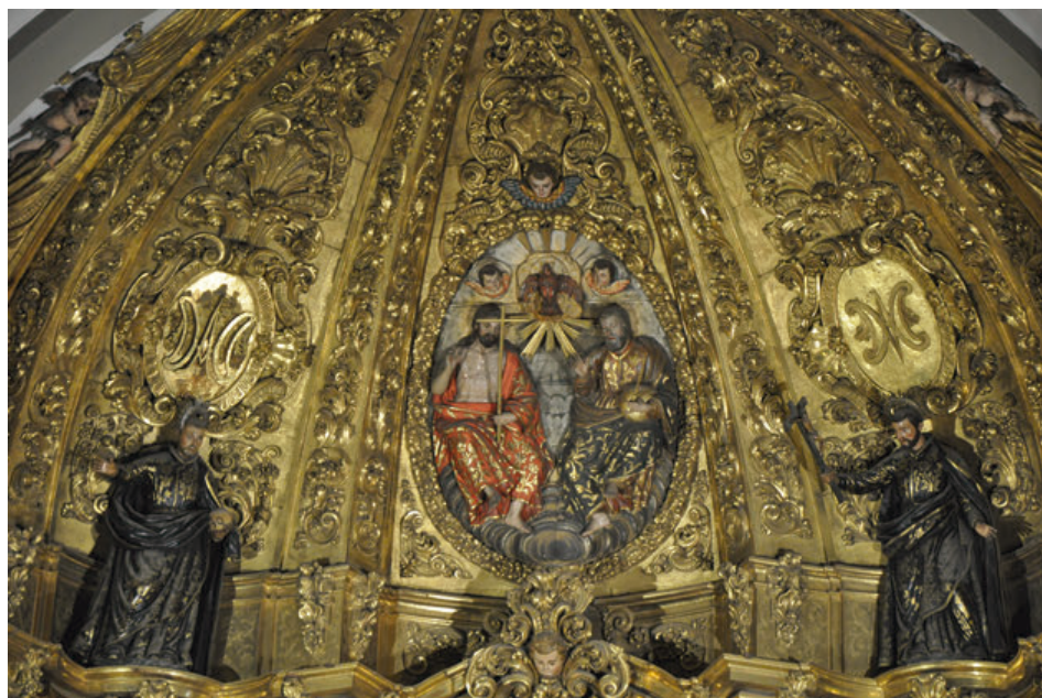
Fig. 9. Detalle del retablo mayor de la iglesia del antiguo colegio de la Compañía de Jesús de Tudela, actual parroquia de San Jorge el Real.