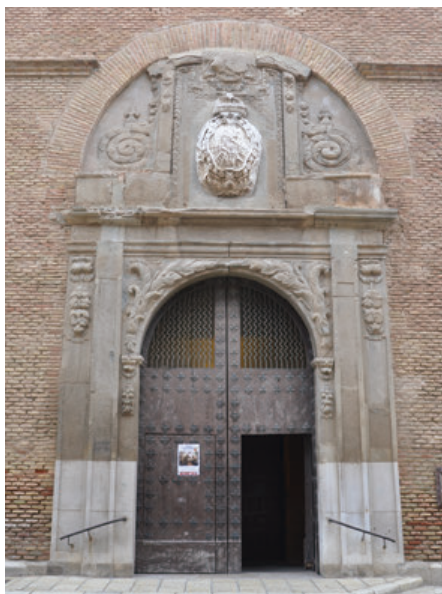
Fig. 6. Portada de la iglesia del antiguo colegio de la Compañía de Jesús de Tudela, actual parroquia de San Jorge el Real.