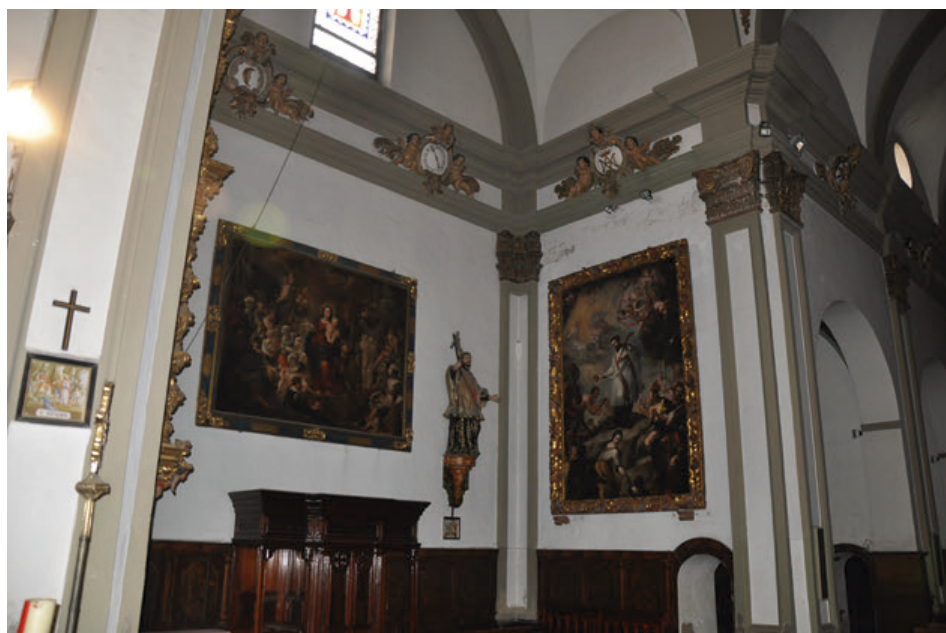
Fig. 10. Vista del brazo derecho del crucero de la iglesia del antiguo colegio de la Compañía de Jesús de Tudela, actual parroquia de San Jorge el Real.