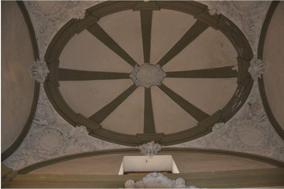
Fig. 11. Bóveda de la antesacristía de la iglesia de la iglesia del antiguo colegio de la Compañía de Jesús de Tudela, actual parroquia de San Jorge el Real.