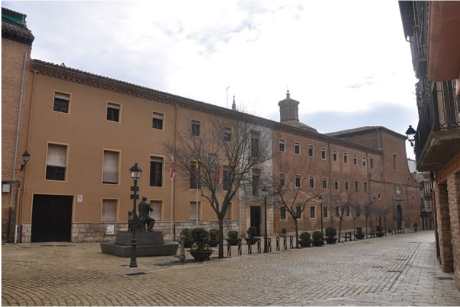
Fig. 1. Fachada del antiguo colegio de la Compañía de Jesús de Tudela a la calle del Mercadal.