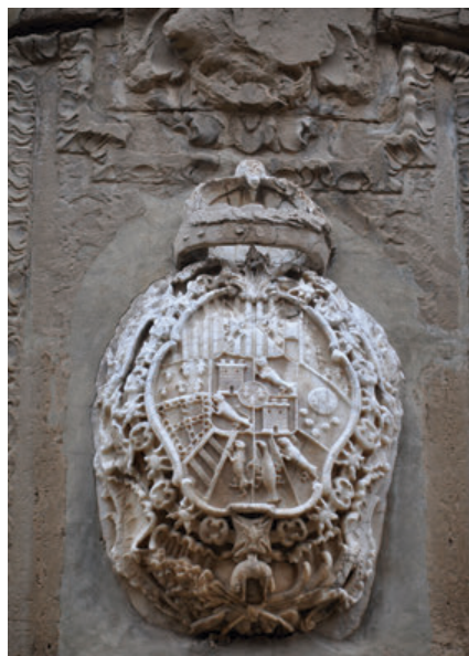
Fig. 7. Detalle del escudo real en la portada de la iglesia del antiguo colegio de la Compañía de Jesús de Tudela, actual parroquia de San Jorge el Real.