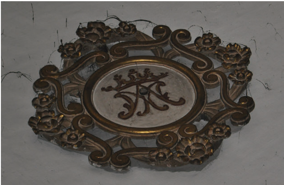
Fig. 12. Florón de madera con las iniciales del nombre de María, dispuesto en la bóveda de la iglesia del antiguo colegio de la Compañía de Jesús de Tudela, actual parroquia de San Jorge el Real.