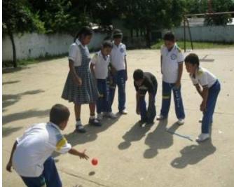
Jugando El jimy

Tema: Vivamos con los juegos tradicionales