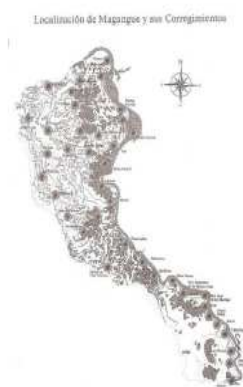
Figura 2: Municipio de Magangué