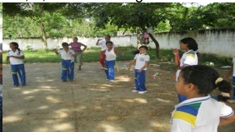
Jugando arroz con leche