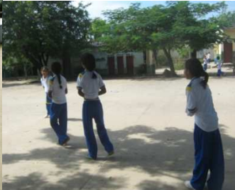
Jugando El 4, 8, 12.