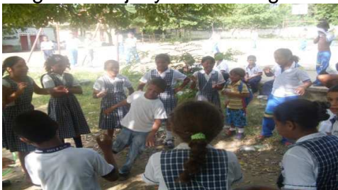
Jugando El vasito con agua.