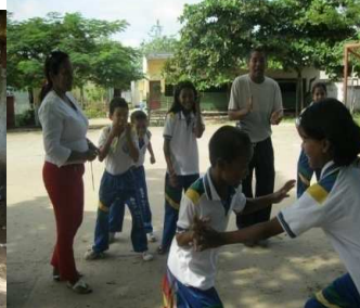
jugando La lleva

Mediante los juegos tradicionales realizados en la Institución se buscó la vivencia de actitudes, destreza y valores que poseen los niños para estos, como podemos notar se han perdido. Esta actividad nos ha permitido observar la sana convivencia, la disminución de los conflictos y un mayor grado de tolerancia entre ellos.