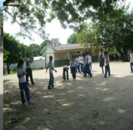
Jugando El calao.