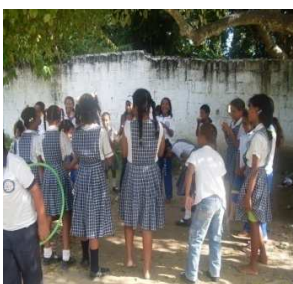
Jugando La Marisola