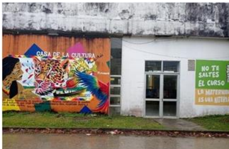
Anexo 2. Infraestructura casa de la cultura puerto Asís Putumayo (página 7).