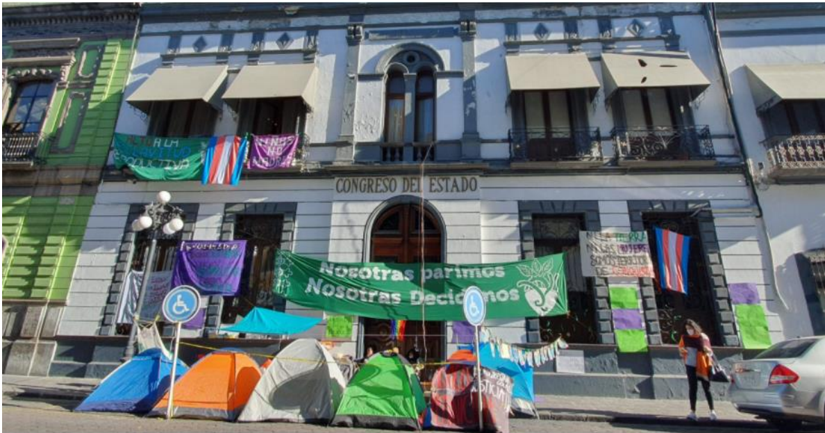
Mely Arellano/Lado B