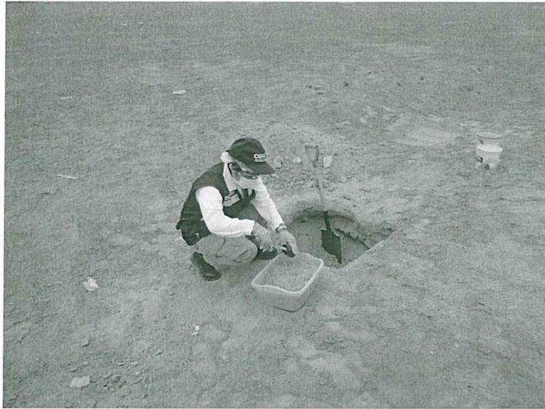
Fotografía 1. Punto de muestreo SU-01 BMCH. Botadero de residuos sólidos de la municipalidad provincial de Chincha. 4 de junio de 2014.

"Decenio de las Personas con Discapacidad en el Perú" "Año de la Promoción de la Industria Responsable y del Compromiso Climático"