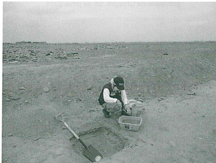
Fotografía 2. Punto de muestreo SU-02 BMCH. Botadero de residuos sólidos de la municipalidad provincial de Paita, 4 de junio de 2014.