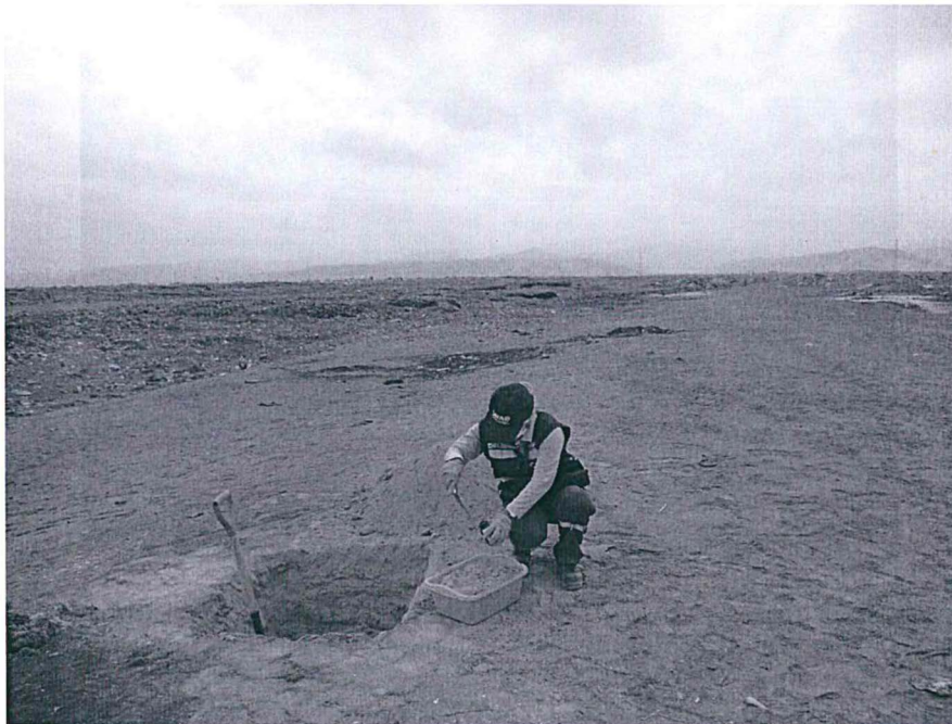
Fotografía 4. Punto de muestreo SU-04 BMCH. Botadero de residuos sólidos de la municipalidad provincial de Chincha, 4 de junio de 2014.