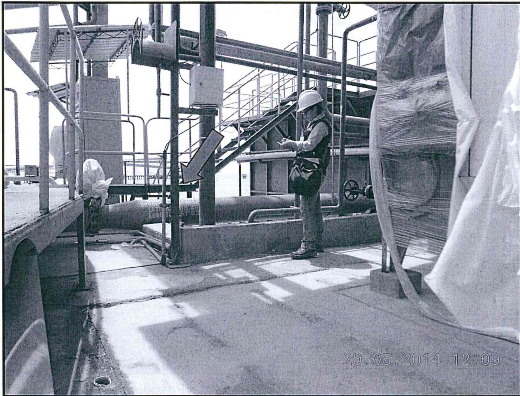
Fotografía N° 03: Punto de Monitoreo efluente de agua de bombeo, después del sistema de tratamiento.

"Decenio de las Personas con Discapacidad en el Perú" "Año de la Promoción de la Industria Responsable y del Compromiso Climático"