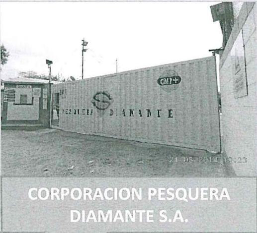
CORPORACION PESQUERA DIAMANTE S.A.