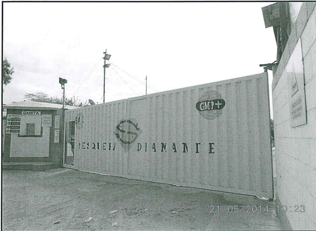
Fotografía N° 01: Frontis de la Planta Industrial Pesquera Diamante S.A.