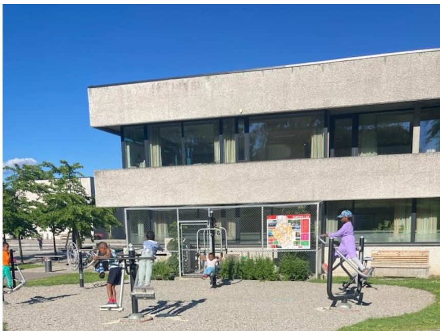
Treningsparken i sentrum