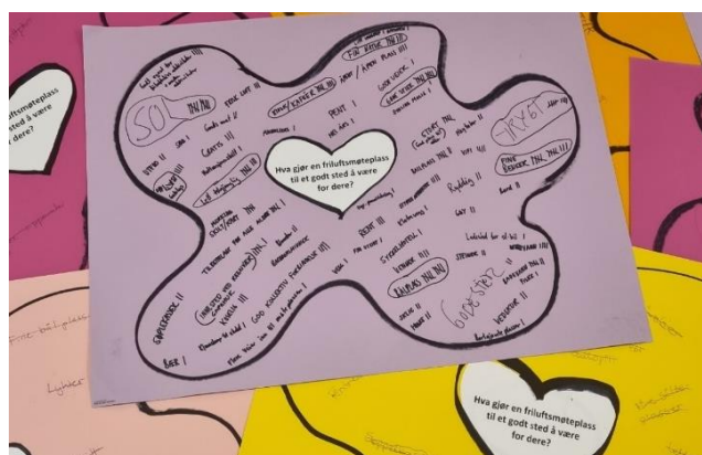
Figur 2. Splot – Hva gjør en friluftsmøteplass til et godt sted å være for dere?

Et annet eksempel på medvirkning som ble gjennomført i samarbeid med de samme studentene (Theodorsen og medarbeidere, 2020), og med samme utvalget, altså tiende klasser fra Ås ungdomsskole, omhandlet hvilke kvaliteter ungdommen mente gode friluftsmøteplasser og andre møteplasser burde ha. Her ble det benyttet den deltakerorienterte kvalitative metoden, SPLOT (Tolstad og medarbeidere, 2017). Dette er en visuell metode hvor deltagerne skal tegne og skrive om steder de «har i hjertet sitt». Metoden er egnet til å utforske opplevelsen av steder deltagerne allerede har et forhold til og komme med innspill og ideer tidlig i en prosess. Denne metoden åpnet for kreativitet og nytenkning.