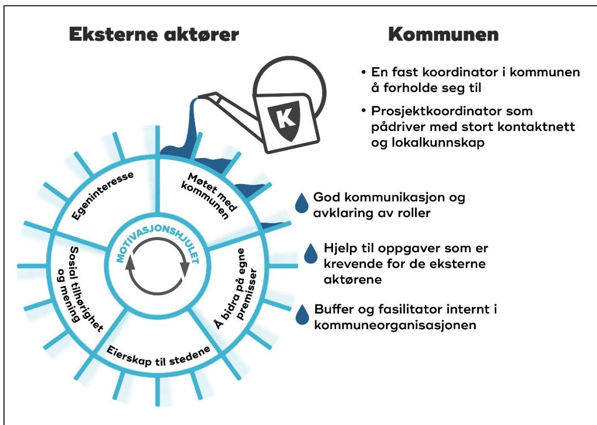
Figur. Kultur for samskaping

Evalueringen av prosjektet viser også at nye og revitaliserte møteplasser blir benyttet av unge og gamle. De fremmer livsglede, tilhørighet, mestring og trivsel; SMIL.