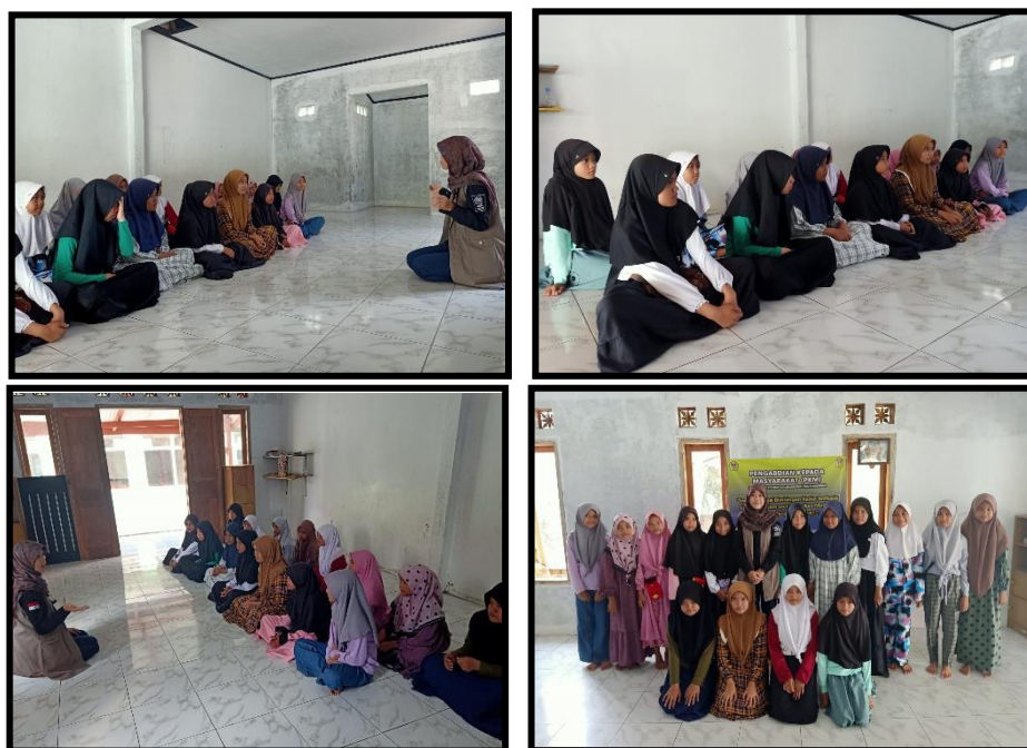
Gambar 1. Dokumentasi Pelaksanaan Kegiatan Pengabdian