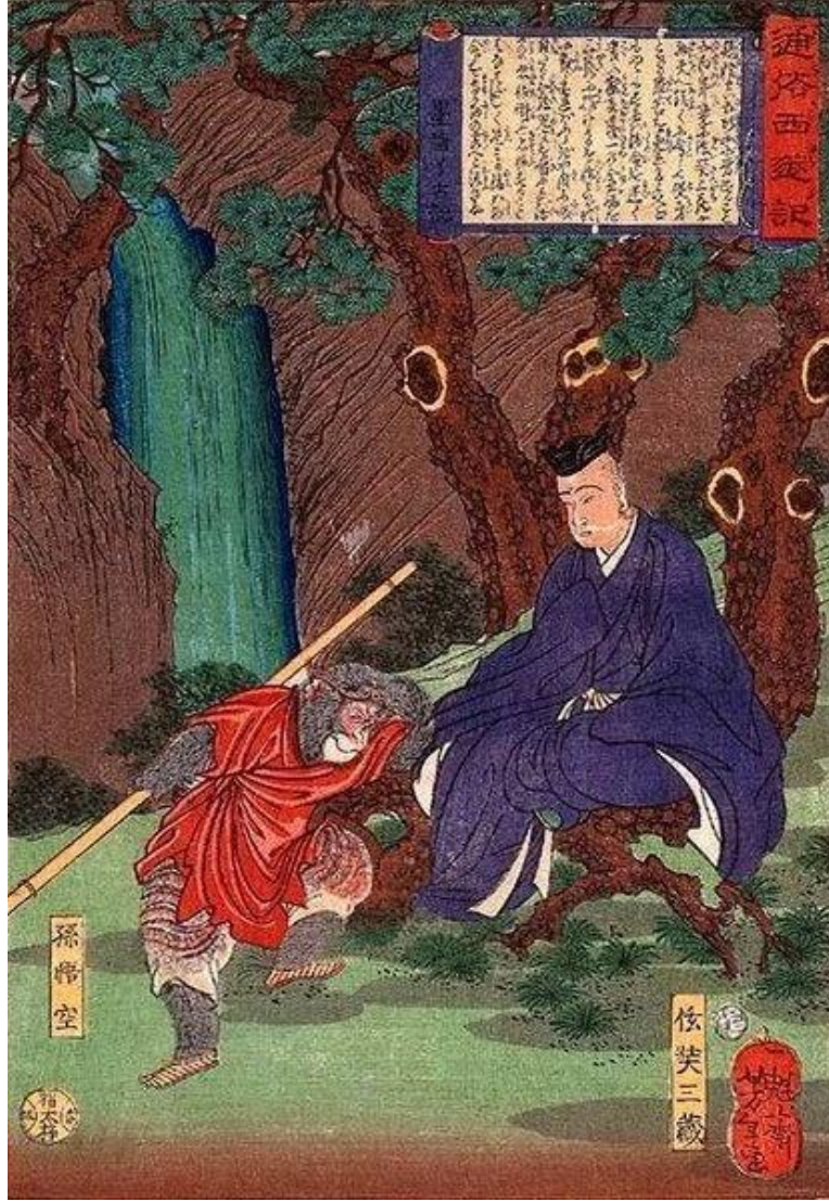
Sun Wukong ve üstadı Xuanzang- Sanzang'ı bir arada gösterir tasvir.