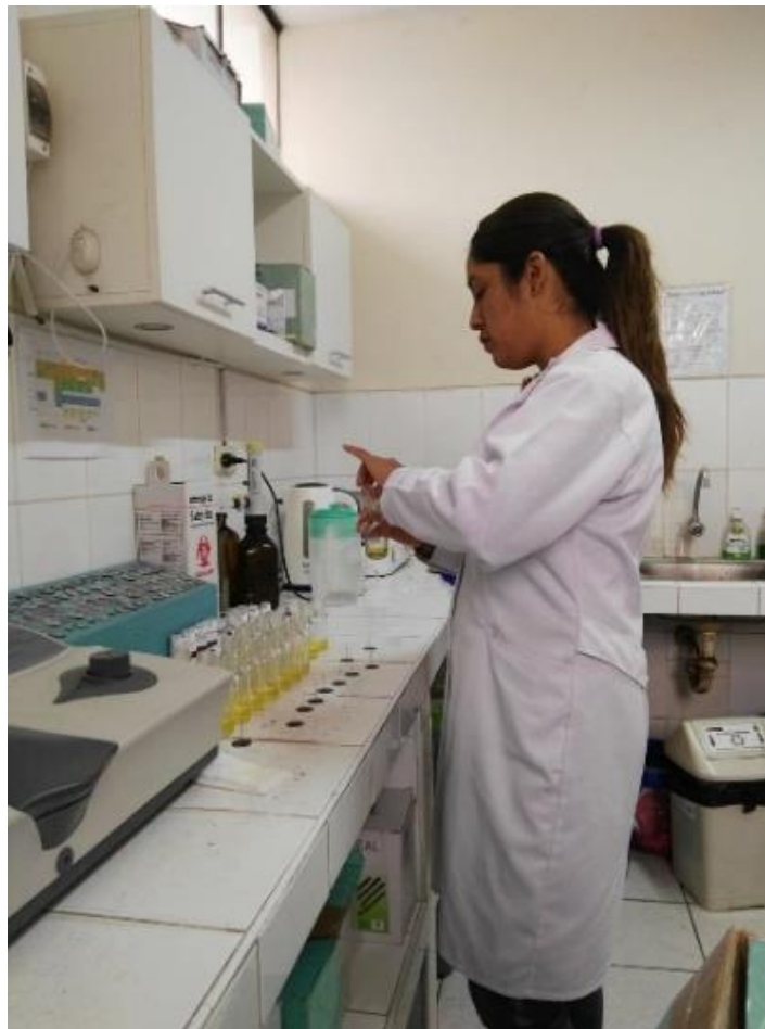
Fig. 1. Dosaje etílico y registro policial de la prueba de alcoholemia por la autora