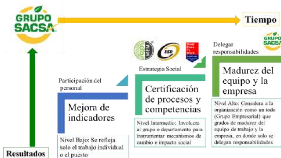
Modelo de sistema abierto del Grupo Empresarial SACSA