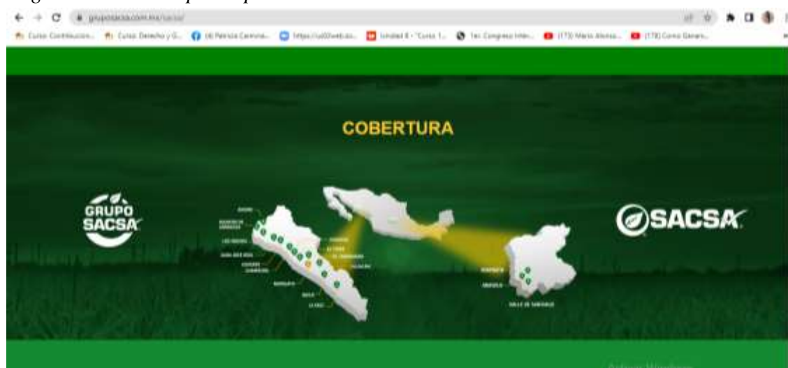
Página web del Grupo Empresarial SACSA

Nota. Imagen tomada de la página web del Grupo SACSA (2022b), que se recuperó para contextualizar la cobertura territorial de la organización.