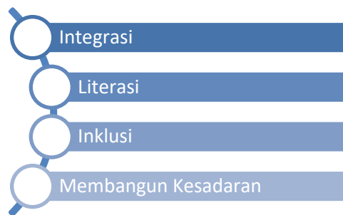
Gambar 2. Inklusi Keuangan