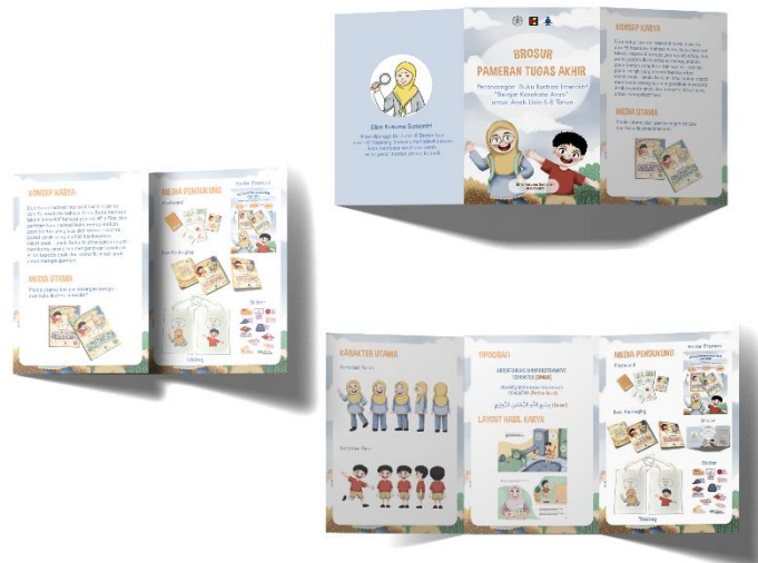
Fig. 12 Brosur pameran