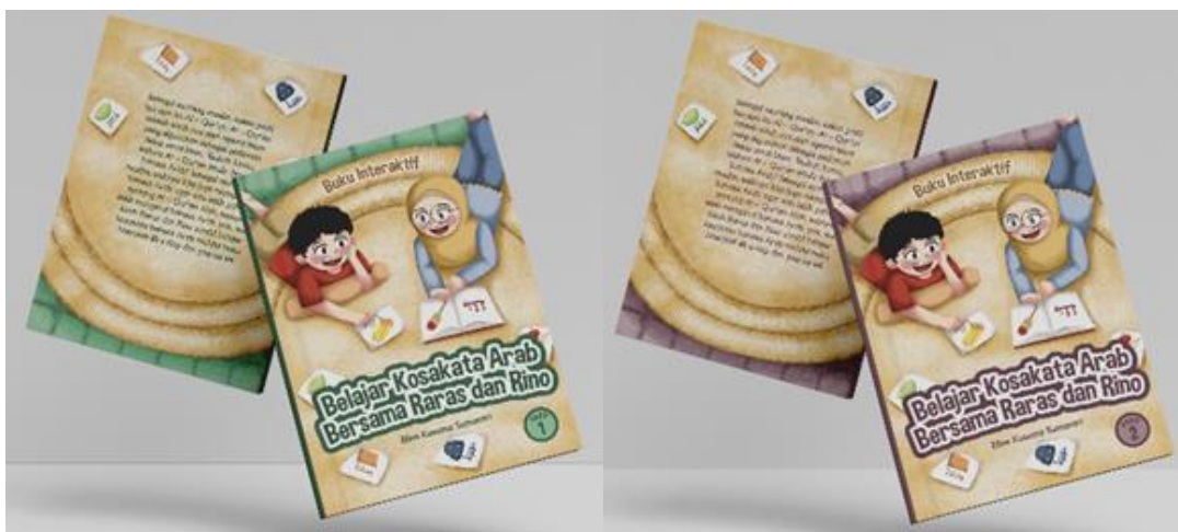
Fig. 2 Buku Ilustrasi Interaktif