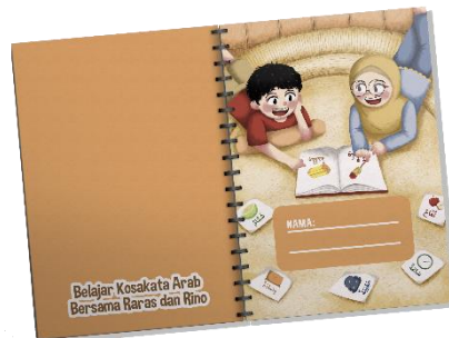
Fig. 10 Notebook