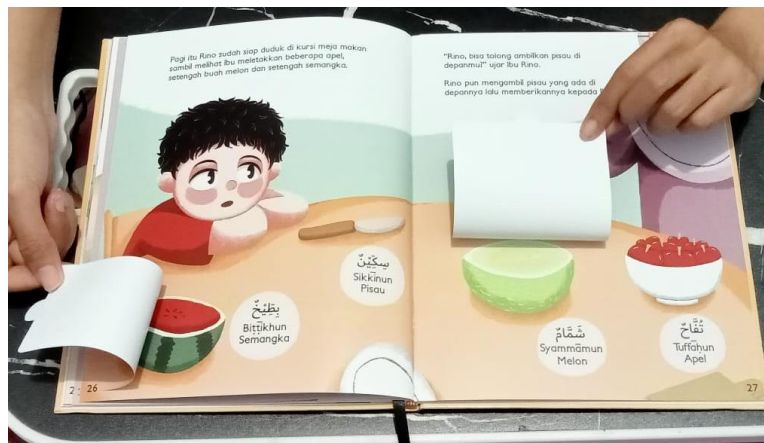
Fig. 4 Salah satu halaman lift a flap pada buku