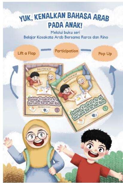
Fig. 6 Poster promosi