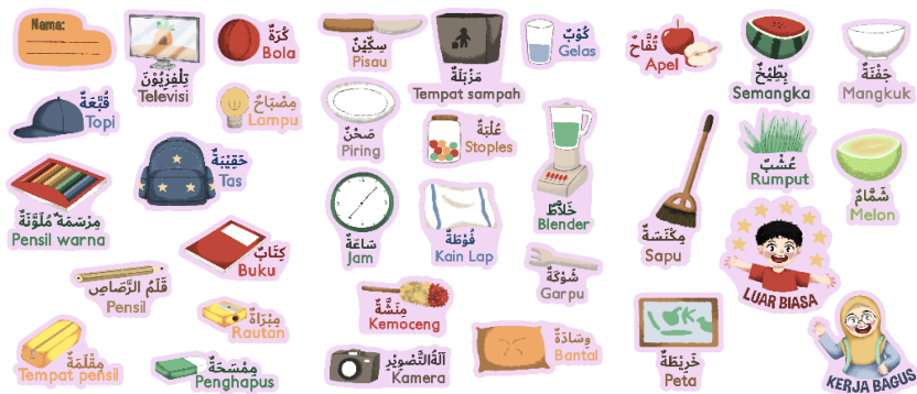
Fig. 7 Sticker