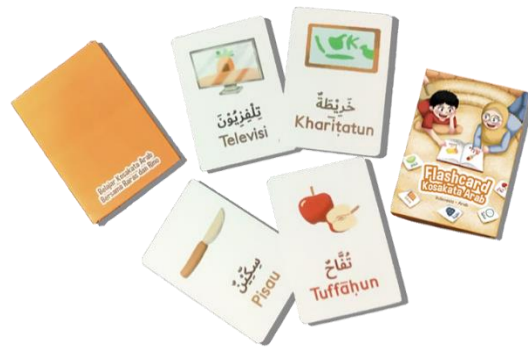
Fig. 9 Flashcard