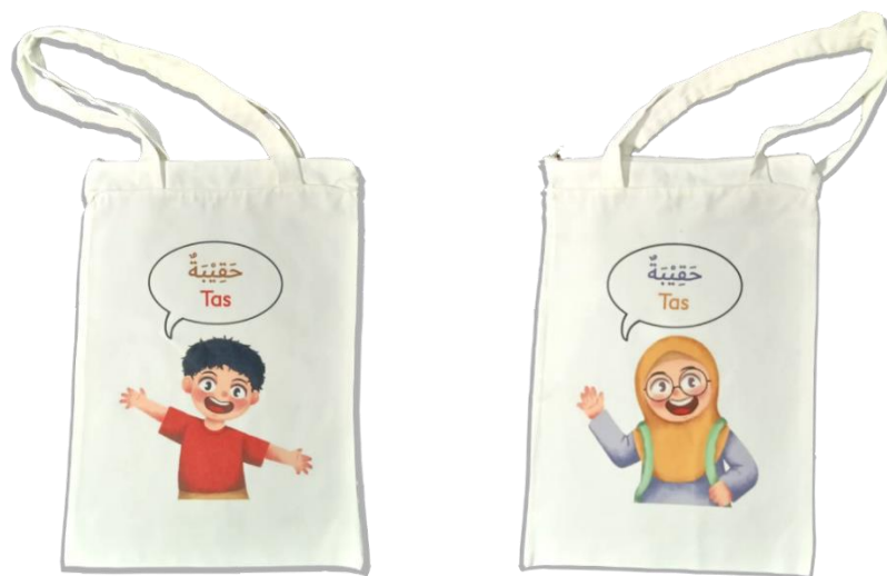
Fig. 8 Totebag