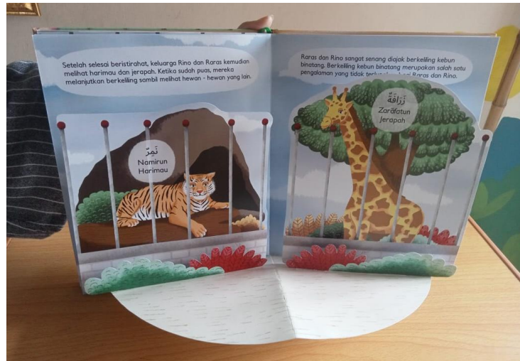
Fig. 3 Salah satu halaman pop up pada buku