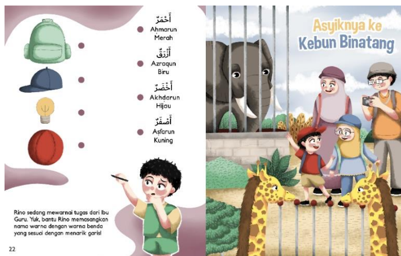
Fig. 5 Salah satu halaman participation pada buku