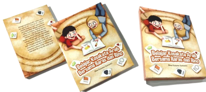
Fig. 11 Box Packaging