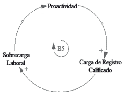
Figura 2. Ciclo de balance entre proactividad, sobrecarga laboral y carga registro calificado.