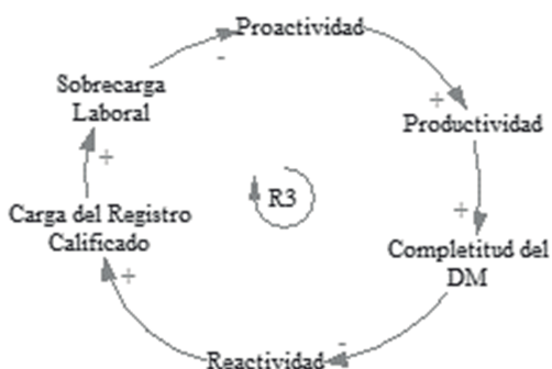
Figura 3. Ciclo de balance entre proactividad, sobrecarga laboral y carga registro calificado.

En la figura 3 se observa el ciclo de refuerzo de la proactividad R3, que describe la relación de la completitud del documento maestro y la influencia de variables de reactividad y proactividad de los actores. Este muestra cómo la proactividad afecta la completitud del documento a la vez que ejerce una reactividad por parte de los actores e induce a una sobrecarga laboral.