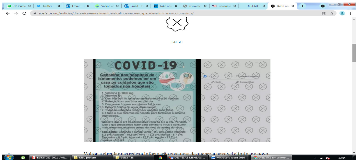
Figura 2 – SD 2 – Post do site “Aos Fatos”

Post veiculado nas redes sociais e checado pelo site “Aos Fatos”. Disponível em: https://www.aosfatos.org/noticias/dieta-rica-em-alimentos-alcinos-nao-e-capaz-de-eliminar-o-coronavirus/