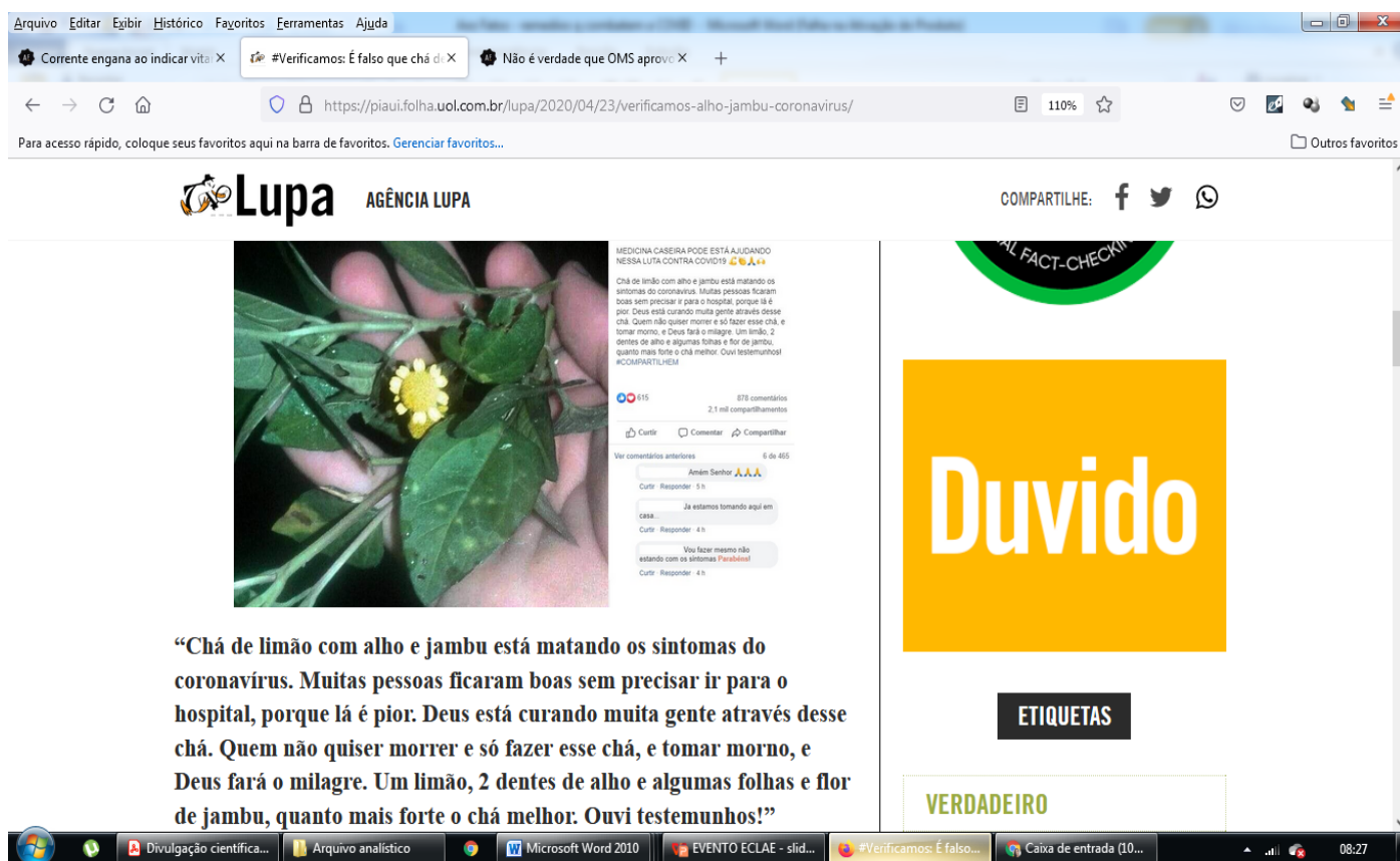
Figura 3 – SD 3 – post do site “LUPA”

Post veiculado nas redes sociais e checado pelo site “LUPA”. Disponível em: https://piaui.folha.uol.com.br/lupa/2020/03/04/verificamos-vitamina-coronavirus/