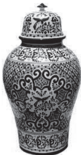
Figura 2. Tibor de Talavera. (Fábrica Uriarte.Puebla, México)

La Talavera es considerada como un tipo de artesanía con características propias en su trazo, en su mezcla de elementos iconográficos y en su paleta de color definida; convirtiéndose en una cerámica de alto valor comercial, por lo que representa en sí misma. De hecho, su origen es incierto, ya que se trata de una transculturación artística generada por un proceso de apropiación tras llegar a México de manos de los colonizadores españoles; e imitado en principio por ceramistas locales que, con el paso del tiempo, hicieron propias las formas antropomorfas estableciendo ligeramente un estilo regional que hoy en día alcanza tal nivel de diseño, que se considera una práctica mexicana de tradición. (Leoni, 2017 p.7).