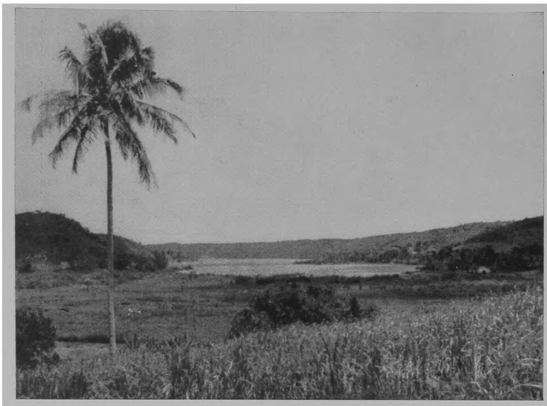
Fig. 6 — Vista da Lagoa de Jiquiá, próximo ao local em que a expedição de 1952 realizou os seus trabalhos.