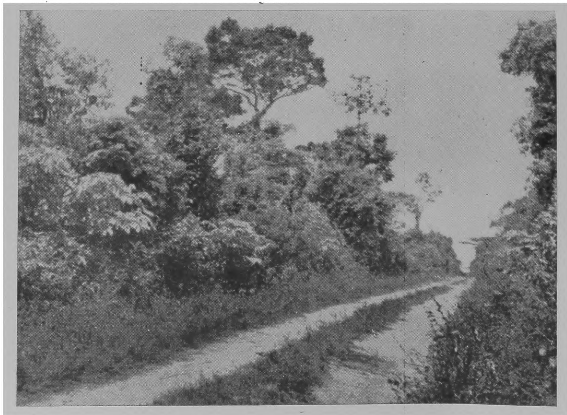
Fig. 3 — Estrada mestra ladeando as matas de São Miguel.