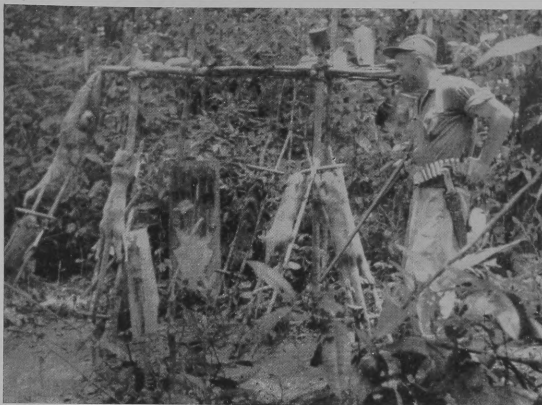
Fig. 4 — Em São Miguel, o sr. E. Dente faz secar ao ar livre peles recém-preparadas de mamíferos.