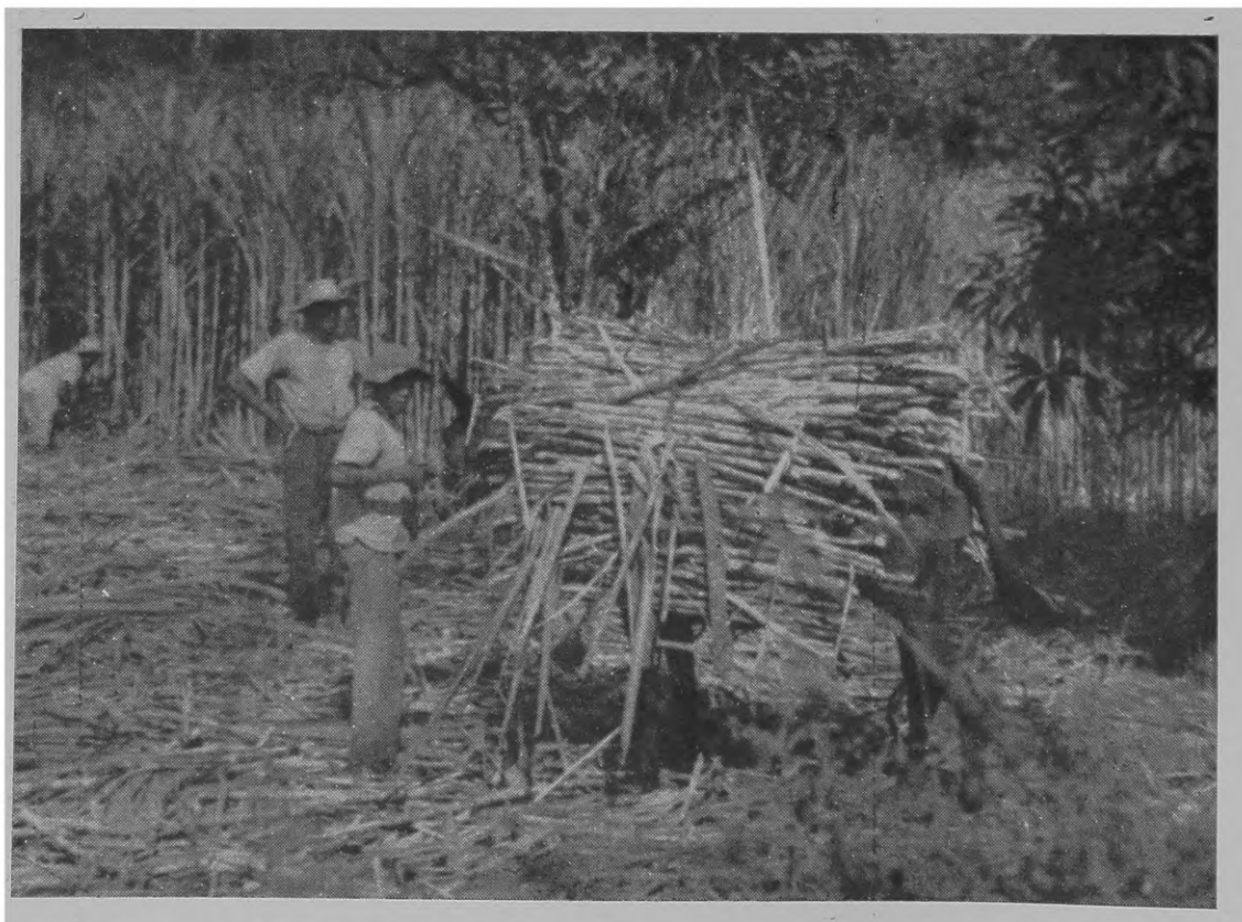
Fig. 7 — Nas baixadas da Usina Sinimbu o transporte da cana em lombo de burro é ainda praticado em escala apreciável.