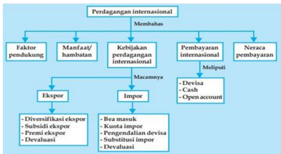
Gambar 2. Konsep Materi Perdagangan Antar Negara

pembelajaran mind mapping . Berikut adalah konsep materi yang akan dibahas dalam media mind mapping .