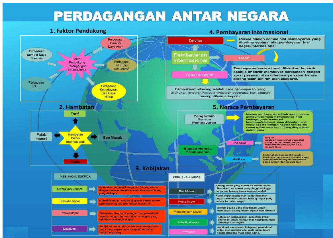
Gambar 3. Media Pembelajaran Mind Mapping untuk mata pelajaran perdagangan antar negara