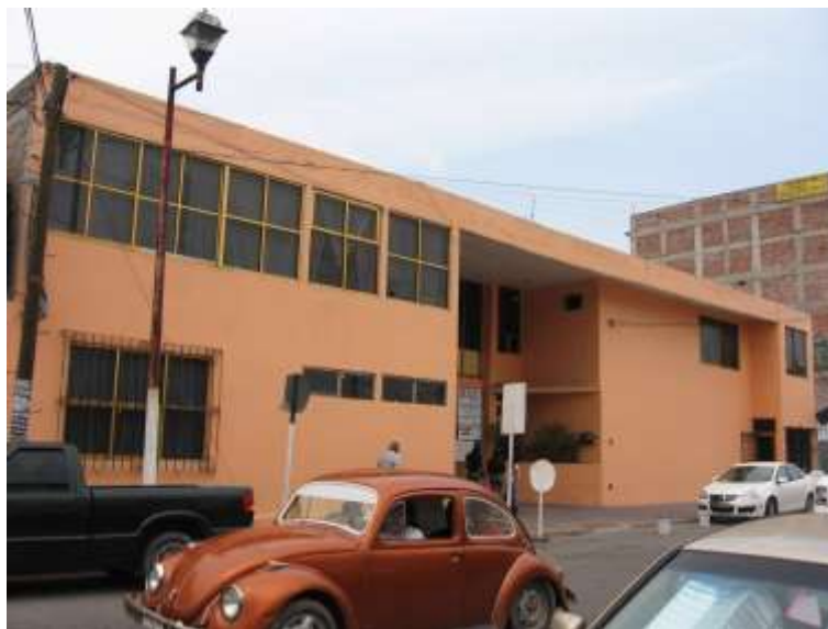
Edificio del DIF Municipal de Zumpango, donde inició la UAP Zumpango en 1987 y permaneció hasta 1988, albergó las dos primeras generaciones, (foto archivo personal de Gonzalo Alejandro Ramos).

Tanto las personas relevantes y con ciertas capacidades y/o poder, así como como las instituciones influyen de manera central con sus acciones u omisiones en la conformación de la historia, en este caso de la historia de Zumpango. Lo mismo sucede con una comunidad, una entidad nacional, o con todo el país, los cambios que ha tenido la región Zumpango, hoy no pueden explicarse omitiendo la presencia desde 1987 de la Unidad Académica Profesional Zumpango (UAPZ). La cual inició sus actividades en las instalaciones del DIF Municipal, y dos años después se mudó a un edificio que ocupara lo que fue un hospital de especialidades, el cual pronto resultó insuficiente y tuvo que complementarse con la renta de algunas casas aledañas o aún en otros barrios de Zumpango para dar cabida a la creciente matrícula y a las necesidades específicas de espacios para algunas de las licenciaturas.