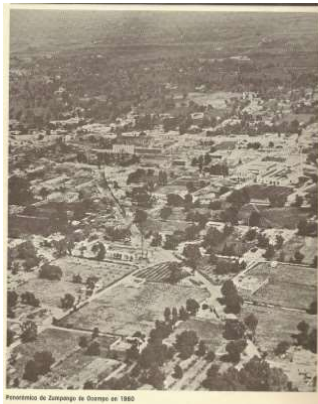
Foto aérea tomada de Ramírez Curiel A, Monografía de Zumpango, 1984.

El ritmo de modernización en México ha sido acelerado, en la década de los sesenta del siglo XX, Zumpango presentaba un panorama más rural que urbano igual que gran parte del país. En esa década el ritmo del cambio era lento, parecía que poco o nada cambiaba.