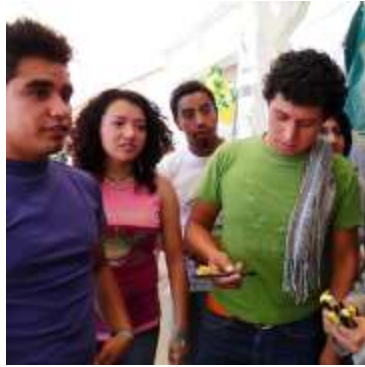
La pluma con la abejita UAEM

Ya faltaban pocos días para el aniversario y muchos ya estaban impregnados de ese ánimo de fiesta. La labor de la coordinadora de Difusión Cultural, en colaboración con las maestras de la comisión, había rendido frutos. Varios compañeros profesores apoyaban al animar a sus alumnos a que se unieran a la fiesta, portando la camiseta y estando presentes el día de la celebración. Pero ahora venía lo más difícil. ¿Habría suficiente comida y pastel para una comunidad tan grande? ¿Cómo podría obtenerse un pastel para tres mil personas? Para la que escribe, que había trabajado en las oficinas de una famosa pastelería en los años ochenta, me parecía que iba a ser muy costoso. Pero una de las profesoras encargadas estaba en pláticas con una panadería y al parecer donarían varios kilos de pastel, con lo cual estaba resuelto en gran parte el problema. Sin embargo, días después llegó muy preocupada diciendo que no eran kilos, que eran gramos, por lo cual regresábamos al punto de partida pues el pastel donado apenas alcanzaría para unos cuantos. ¿De dónde saldría el gran pastel? Finalmente se resolvió por parte de la Administración del Centro Universitario y el día 17 de septiembre se partieron dos grandes pasteles y todos los universitarios que ese día llegaron al Pabellón Universitario, la mayoría con la camiseta puesta, pudieron comer no solamente la rica taquiza que se sirvió, también una buena rebanada de pastel.