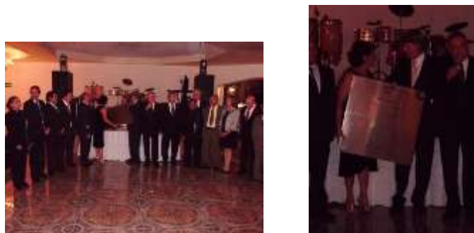
Entrega de la Placa Conmemorativa