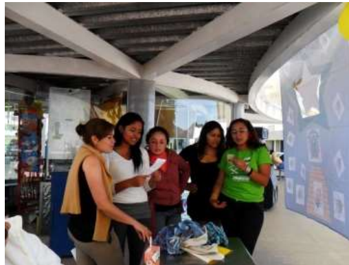
Equipo de la Licenciatura en Economía