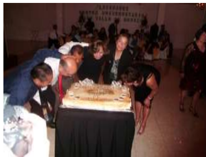
Los profesores y administrativos que cumplieron quince años de labor