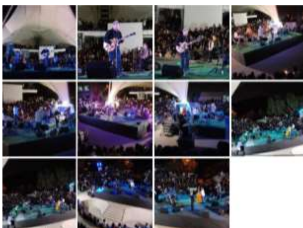
El concierto de Paté de Fúa en el Pabellón Universitario