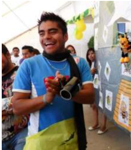
La preciada taza Centro Universitario UAEM Valle de México