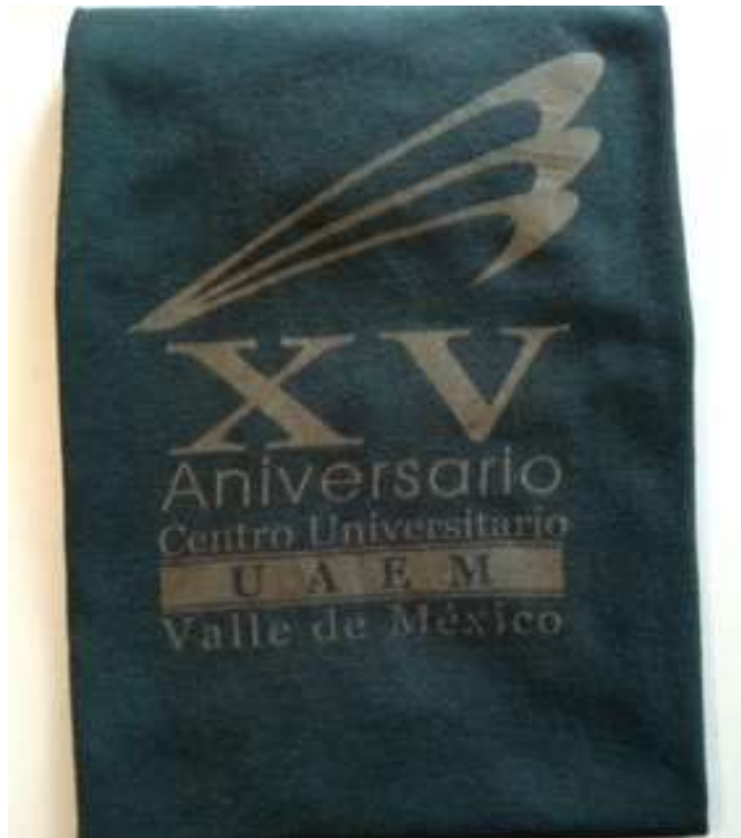
Las camisetas en Verde y Oro