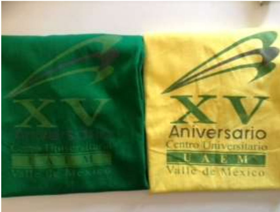
Las primeras camisetas del XV aniversario