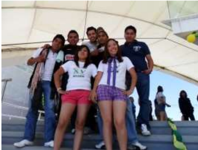
Así lucieron los alumnos con sus camisetas del XV aniversario