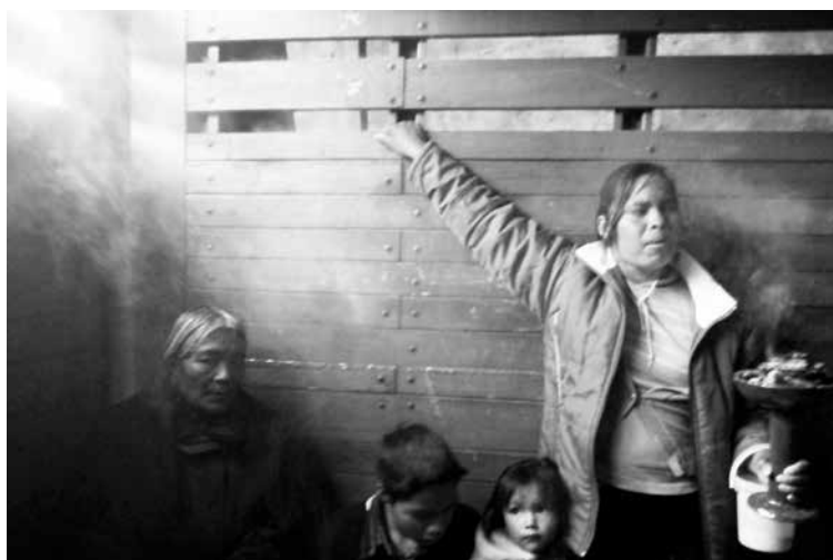
Redilas (2012), Temascalcingo, Estado de México.

Hoy en día, la fotografía constituye un recurso para el estudio de la realidad desde la antropología social. Debido a su valor etnográfico, es un instrumento metodológico que permite capturar en imágenes la diversidad cultural del ser humano. Sin embargo,