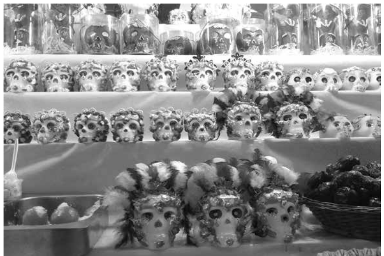
La muerte popular (2012), Toluca, Estado de México.