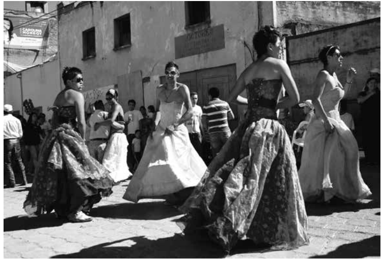
Quinceañer@s (2012), Metepec, Estado de México.

de la comunicación, de los procesos migratorios y de urbanización, la cultura popular también encuentra sus escenarios en la ciudad, a través de ferias, fiestas y carnavales; su ritmo y colorido se instalan, recorren las calles y los recintos urbanos, convirtiéndose en espectáculo. De ahí las fotografías de las calaveritas de azúcar del día de muertos, los juguetes de madera y de tela,