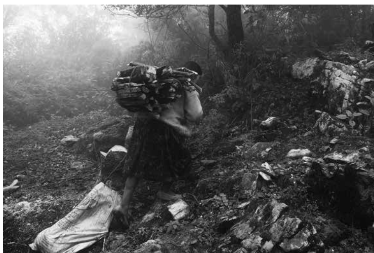
La fuerza de mi pueblo (2012), Sierra de Zongolica, Veracruz.

Para la antropología, por lo tanto, es fundamental el estudio y análisis de la cultura: