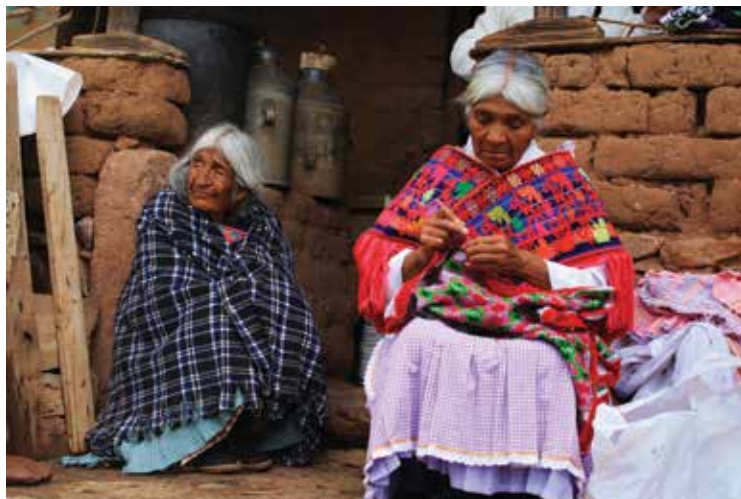
Bordando mi historia (2012), Temascalcingo, Estado de México.