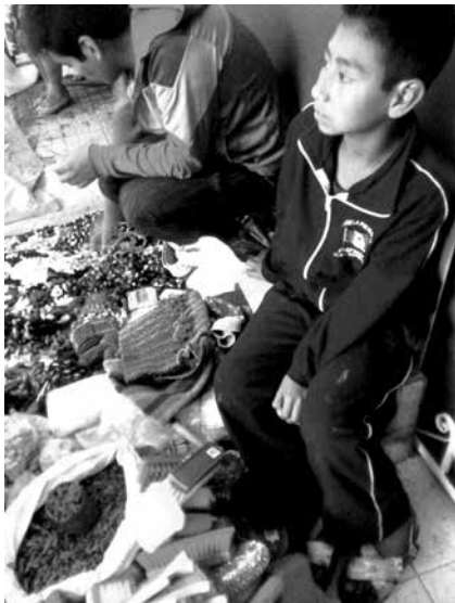
Vendiendo con indígenas (2012), Toluca, Estado de México.

junto con sus vendedores, indígenas que migran a los centros económicos trastocando su identidad, imágenes que dan un toque de tradición a Los Portales de Toluca.