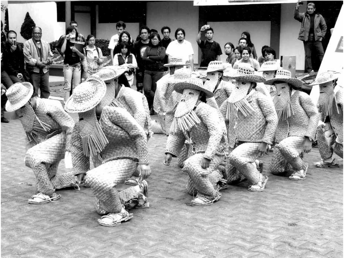
La danza del Tule (2012), Toluca, Estado de México.