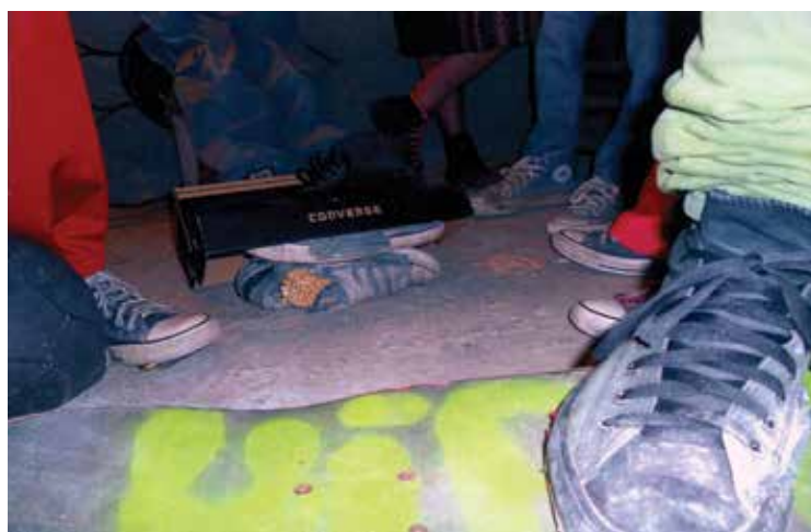
¿Globalización? (2012), Santiago Tlacotepec, Estado de México.