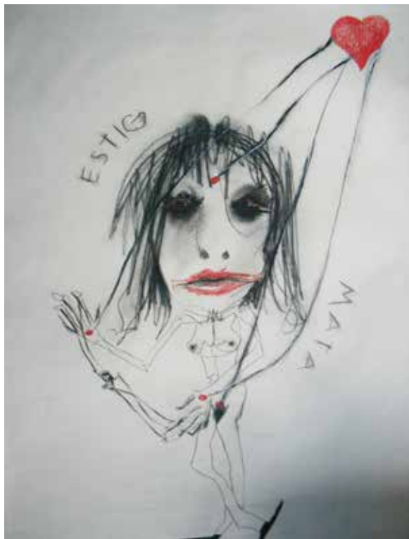
Estigmata (2008). Lápiz graso sobre papel: Layla Cora.

—como si al fin el tiempo coincidiese consigo mismo y yo con él, como si el tiempo y sus dos tiempos fuesen un solo tiempo