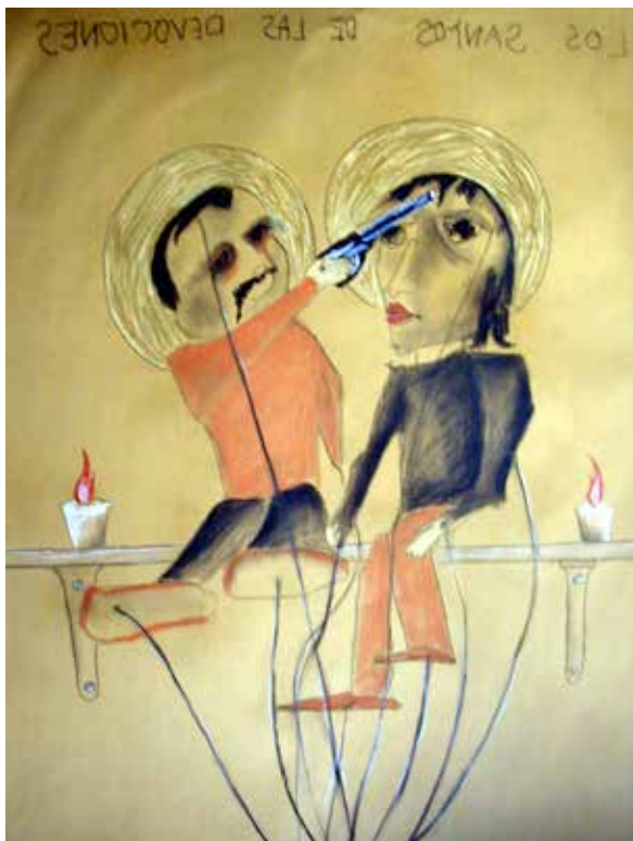
Los santos de las devociones (2008). Lápiz graso sobre papel: Layla Cora.

El sentido de extravío, pérdida, naufragio, “entretejidas vocales, consonantes: casa del mundo” (Paz, 1987: 14), de vivencias percibidas, extrañas y enemigas, producen y traducen experiencias de indecisión, incertidumbre, perplejidad, titubeo, duda, vacilación, confusión, ambigüedad, equivocidad, turbulencia, inquietud, intranquilidad, inestabilidad, desequilibrio... y configuran, dibujan estados de indefinibilidad algo más que los indescifrables estados de nostalgia, añoranza, deseo por lo ausente, dolor por la invisible presencia, pesar por la tangibilidad no palpable, por la sonora inaudibilidad, por la deletreable mudez de lo arrebatado, perdido, desgajado de la propia existencia. Y todo porque el problema no es ‘ser o no ser’, sino ‘ser aquello’ que todo hombre es: angostamiento, estrechez, sofocamiento... y no ser el que ‘se es’: siempre él mismo, pero nunca y siempre lo mismo. Ser morada y vivir a la intemperie, habitar en la claridad de un borrascoso, desteñido, huracán, brusco, arisco,