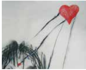
Detalle de Los santos de las devociones (2008). Lápiz graso sobre papel: Layla Cora.