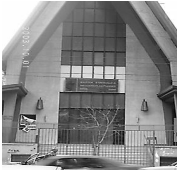
Imagen 1: Templo Metodista de flores (fachada)

http://www.google.com.mx/imgres?imgurl=http://www.losmejoresdestinos.com/mapa_buenos_aires_barrios