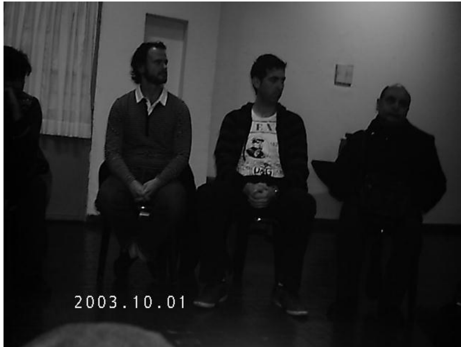
Foto 2: reuniones mensuales en Iglesia Metodista de Flores