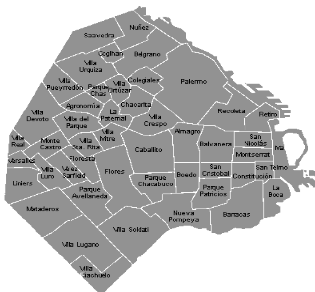
Mapa 1: ubicación del barrio de Flores Bs. As.

Las reuniones en la calle Yerbal 2451 en el Barrio de Flores, Frente a la Plaza Pueyredon entre las calles General G. Artigas y Fray Cayetano Rodríguez, utilizando las instalaciones de un Templo Metodista, cercano a algunas de sus ideas en torno al papel de la homosexualidad en la religión. Estas se realizan una vez al mes a partir de las 7 p.m. con una población flotante 10 e irregular, que asiste de acuerdo a la satisfacción de sus necesidades particulares.