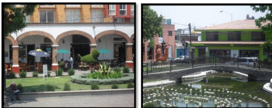
Figura 1: Empresas tipo independiente, ubicadas en el centro del municipio de Metepec

Hay que destacar que las cinco primeras dimensiones de esta primera variable, están representadas por los factores que determinan la rentabilidad de la industria, y que influyen en los precios, en los costos y en la inversión que deben realizar las empresas. Por ejemplo, la fuerza de los compradores incide en los precios, lo mismo que la amenaza de sustitución; también influye en los costos y en la inversión porque los clientes cada día exigen un servicio de mayor calidad y por lo tanto con mayor costo para la empresa, relación que no debería presentarse, pero que finalmente expresan los empresarios. El poder negociador de los proveedores determina el costo de las materias primas y de otros insumos. La rivalidad incide en los precios y los costos de competir en el desarrollo de productos, publicidad, instalaciones y la fuerza de ventas. La amenaza de la entrada limita los precios y moldea la inversión necesaria para disuadir a otros participantes, aspectos que Porter (2010: 5) menciona y se comprobó en los resultados mencionados dentro de estos factores externos. Dentro del municipio se pueden observar establecimientos como los vistos en las Figuras 1 y 2.