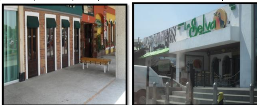
Figura 2: Empresas de tipo franquicia o cadena ubicadas en el municipio de Metepec