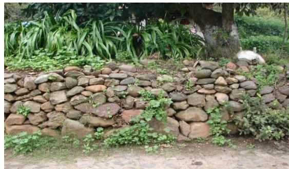
Figura 2. Delimitación denominada "tecorral" presente en los huertos familiares de San Nicolás

Los huertos que presentan patio para elaborar composta son diez (71%) y los huertos que no cuentan con estos espacios son cuatro (29%). La composta es elaborada con diversos componentes locales: desechos de deshierbe (5 huertos), desperdicios de la cocina y excretas de animales (4), hojas de los árboles y ramas (2) y ceniza (1). La composta es aplicada en las parcelas agrícolas (50%), y en el propio huerto (50%).