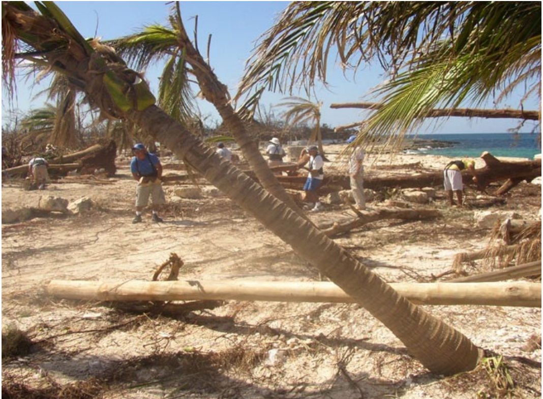
Ilustración 1. Destrucción del Parque Chankanaab por “Wilma”

El principal factor de corrección (FC) de origen natural es la precipitación (FCpre) en la forma de huracanes, que se acompaña de anegamientos (FCane). Los que afectaron al Parque fueron “Emily” (julio de 2005), que obligó al cierre temporal (FCctem) por 15 días y “Wilma” (octubre de 2005) durante ocho meses (Ilustración 1). Esta restricción es absoluta ya que implica un riesgo para la seguridad de las personas y no es posible establecer valores promedio ya que los procedimientos determinan la restricción total del acceso al Parque y se habilita nuevamente al público cuando no existen situaciones de anegamiento u otros riesgos. Con respecto al brillo solar (FCsol), no se considera un factor restrictivo, sino parte del atractivo turístico demandado por los visitantes.