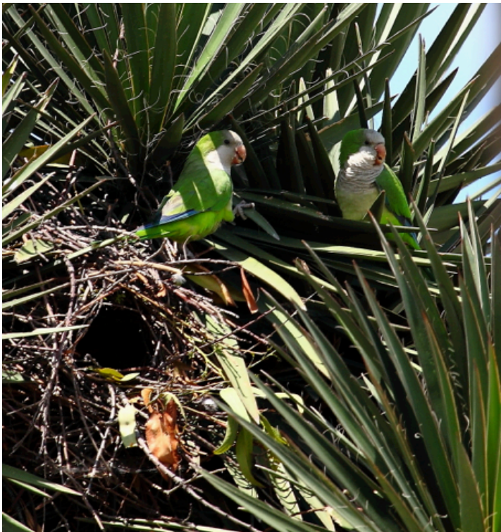
Figura 4 Nido activo de cotorra argentina en un izote ( Yucca spp.) en San Bartolomé Tlaltelulco, Metepec, Estado de México.