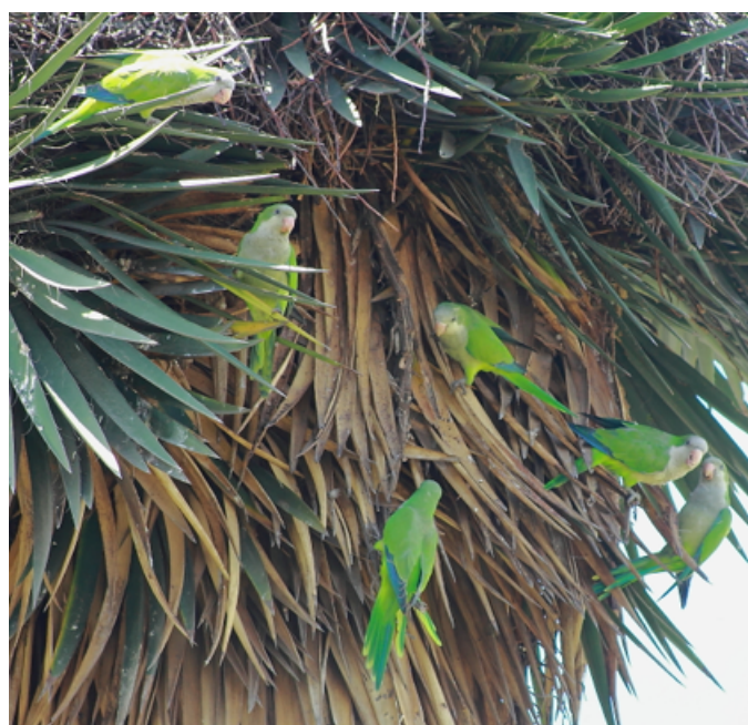
Figura 2. Individuos de la cotorra argentina posados en un izote ( Yucca spp.) en San Bartolomé Tlaltelulco, Metepec, Estado de México.

Estos avistamientos son relevantes para iniciar una monitorización temprana como lo determina la Estrategia Nacional sobre Especies Invasoras en México, que hace hincapié en la prevención, detección temprana y el control o erradicación de las especies invasoras (CANEI 2010). Por lo tanto, y siguiendo dichos lineamientos, sugerimos prohibir su venta en México y fomentar campañas de concientización para impedir su compra y evitar liberaciones. De manera particular para el Estado de México, y a partir de los lineamientos del Código para la Biodiversidad del Estado de México (CBEM, 2005), recomendamos iniciar un programa de control reproductivo en zonas de anidamiento (Avery et al. 2008).