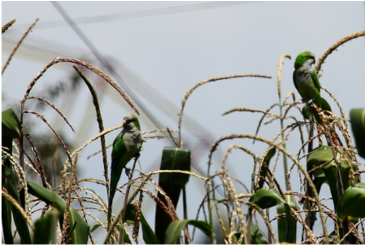
Figura 3. Individuos de la cotorra argentina alimentándose de espigas de maíz en San Bartolomé Tlaltelulco, Metepec, Estado de México.