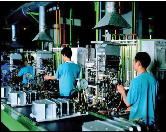
Figura 3. Combinación de los factores de la producción. La combinación óptima del factor capital, representado por las máquinas, y el empleo por los trabajadores, permiten obtener una eficiencia técnica total.

ción de la eficiencia, en todos se identifica la existencia de ineficiencias. En el caso de Becerril et al. (2010), el estudio considera el periodo comprendido desde 1980 hasta 2003 con información y periodicidad de los Censos Económicos del INEGI, lo que lleva a comparar únicamente los resultados del año 2003 respecto a este estudio. De ello, estos autores también encuentran ineficiencias en el uso factorial, en aquel caso, para el año 2003 de 0.20 o 20%, que al contrastar con las de este estudio, éstas son del 43%. La diferencia puede estar siendo generada porque aquella es calculada con información nominal, en tanto que la de este documento es considerada en términos reales, utilizando deflatores individuales para cada entidad federativa. Asimismo, respecto al trabajo de Chávez y Fonseca (2013), es orientado