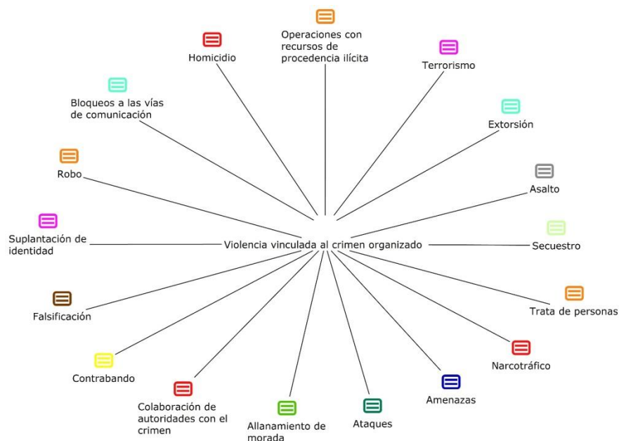
Figura 2. Clasificación propuesta de la violencia vinculada a la delincuencia organizada

El nuevo sistema de códigos fue modelado con ayuda de la aplicación MAXMapas de acuerdo con las notas recopiladas, quedando de la forma que la figura 2 muestra. La nueva clasificación incluye ocho nuevos códigos, los cuales surgieron a través del análisis de los textos de las notas periodísticas.