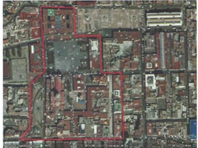
FIGURA 1 CENTRO HISTÓRICO DE LA CIUDAD DE TOLUCA