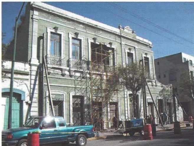
Fotografía 5. Edificio abandonado en el primer cuadro de la ciudad de Toluca.

La disminución del pequeño comercio tradicional igual o menor al 50 por ciento, se atribuye principalmente a la instalación de las grandes cadenas de alimentos y electrodomésticos, al ambulante y elevado costo de las ventas (El portal, 2010). La competencia desigual se establece con las franquicias nacionales e internacionales, principalmente tiendas de conveniencia y autoservicio que acaparan la demanda; este fenómeno está asociado a la diversificación y al precio de los productos que ofrecen este tipo de establecimientos.