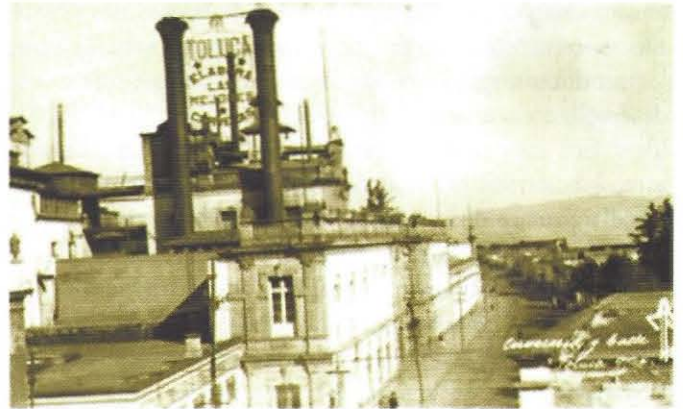
Fotografía 2. Fachada de la Cervecería Modelo.