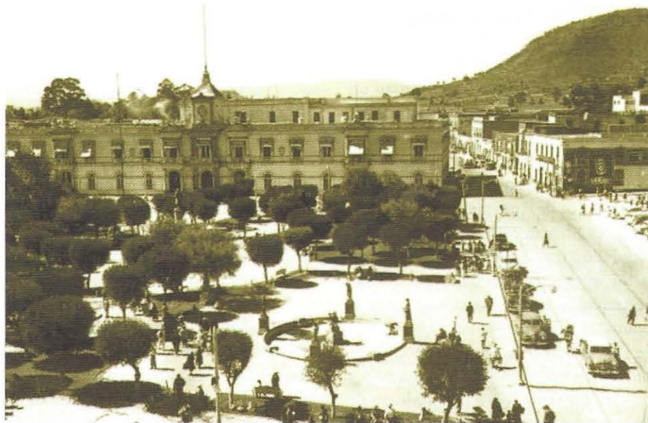
Antigua imagen del Palacio de Gobierno de Toluca.

KEYWORDS: cycle of life, historical center and I trade