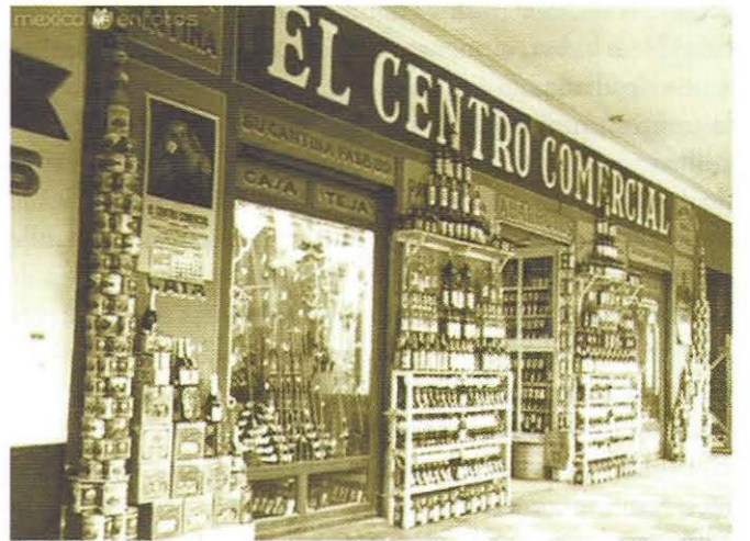
Fotografía 3. Portales del centro de la ciudad de Toluca

El empuje industrial de los años treinta y el establecimiento del corredor industrial Lerma-Toluca en los años sesenta, posesionaron a la ciudad de Toluca en el escenario económico y urbano nacional; el centro y sus alrededores diversificaron las actividades comerciales y los servicios educativos, lo cual incrementó la movilidad de la población en busca de satisfacer algunas necesidades, lo que conllevó al incremento de las rutas de transporte público.