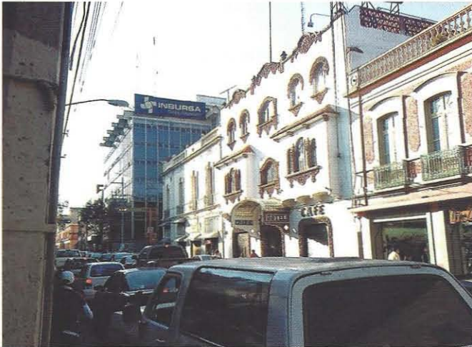
Fotografía 4. Construcción en el centro de la ciudad de Toluca.

(INEGI, 2011), sin embargo, estos productos se venden en los nuevos espacios comerciales (hipermercados), cuya actividad se desarrolla en el propio centro de la ciudad y en su periferia, estos comercios tienen una aceptación social sin precedentes y ofertan en un solo lugar enseres domésticos, productos textiles, accesorios de vestir y calzado, aquellos que originalmente se adquirían en el centro de comercio tradicional de la ciudad de Toluca (Fotografías 4 y 5).