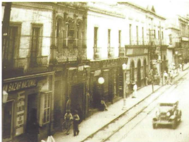
Fotografía 1. Vías de tren en centro de la ciudad Toluca.

En esta fase la comunicación que se estableció en la etapa precedente a partir del ferrocarril y el surgimiento de empresas industriales en la primera mitad del siglo XX, fueron los factores principales de la diversificación de la economía local y detonantes de la urbanización. El símbolo de la transformación fue la compañía Cervecería de Toluca y México, la cual se instaló en el año 1935 sobre la calle Ignacio López Rayón y producía la cerveza Victoria. Paralelamente crece la actividad comercial en los portales y en el mercado 16 de septiembre, estas actividades convirtieron al centro de la ciudad de Toluca en un núcleo de abastecimiento y servicio de alcance regional (Fotografías 1, 2 y 3).