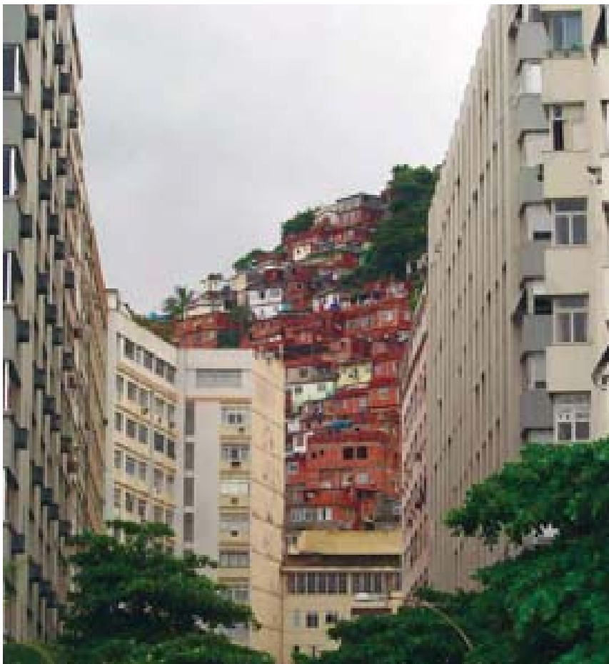
Rio de Janeiro, cuyas favelas y construcciones informales crecen descontroladamente, definiendo una ciudad sin orgánica ni límites precisos, provocando altos índices de inseguridad en la ciudad formal.