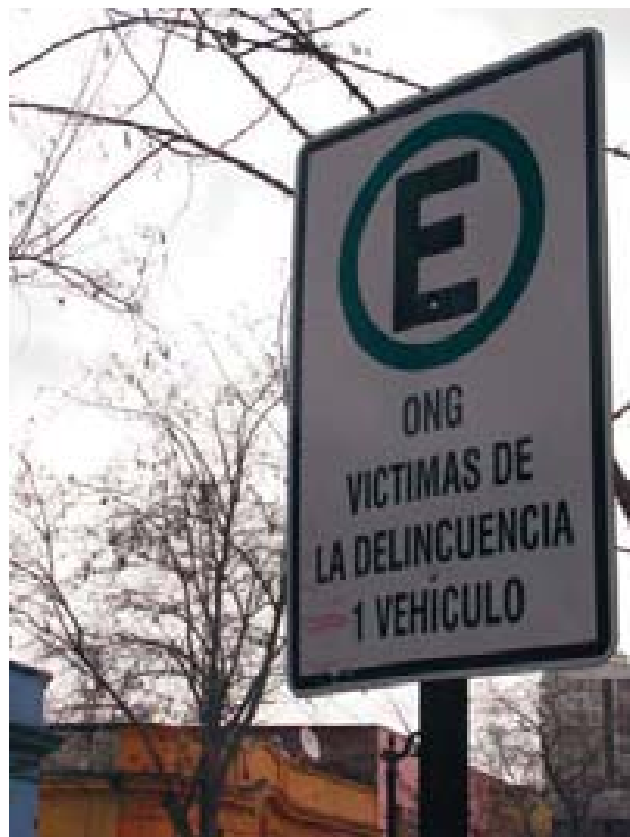
Identificación urbana de la organización ciudadana contra la inseguridad.

“En años recientes Ulrich Beck ha desarrollado el concepto de sociedad del riesgo para subrayar el rol que los sentimientos de incertidumbre y temor juegan en la sociedad globalizada. Según este autor, el proceso de modernización conduce a una situación en la que la probabilidad de trastornos y de desastres es mayor y no menor que antes, debido a los factores de riesgo que se generan a medida que la complejidad de los entramados institucionales aumenta, y a medida que la ciencia y la tecnología