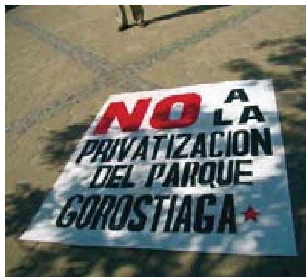
Manifestación vecinal que rechaza la privatización de un parque urbano comunitario y que no considera inversiones inmobiliarias sino su conversión a un centro deportivo en la comuna de Nuñoa. Santiago.

A pesar de esta manifiesta voluntad de separación, de distinción físico-espacial, hubo un cierto pudor en cuanto a la apropiación del espacio público, da la impresión que hubo una intención implícita de esta nueva burguesía urbana por "mostrarse" al resto de la sociedad, por exhibir su nueva forma de vida, por construir un espacio de presunción, una escenografía que mostrara su posición encumbrada e indiscutible en la pirámide social y la mostrara como un modelo de vida al que debía aspirar el resto de la sociedad.