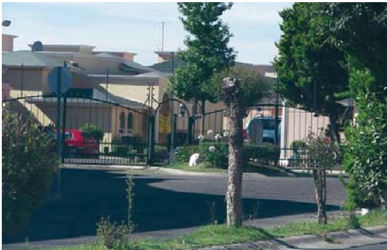
Encerramiento y exclusividad en conjuntos habitacionales del municipio de Metepec, México.

Si tomamos como referencia las situaciones referidas, se puede constatar la presencia de nuevas tendencias en las sociedades modernas, por ejemplo en el sentido que se le ha impuesto a lo que tradicionalmente venía siendo entendido por espacio público. Uno de ellos es la calle, otros, los parques públicos, jardines, alamedas, sólo por citar algunos, en los que, la convivencia se ha venido perdiendo de manera paulatina y “normal”. Por tanto, también se consolida el cambio del sentido y significado que la población tiene sobre éstos, es decir, se les deja de ver como espacios colectivos de socialización y de roce de los ciudadanos, y se les asocia a la idea de un espacio con fuerte contenido de inseguridad, en el que los individuos ven asombrosamente incrementadas las posibilidades de ser tocados, de ser agredidos o violentados en su integridad física