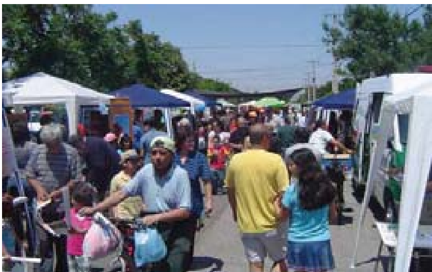
Feria de Seguridad Ciudadana con puestos de información de las diferentes asociaciones sociales, programas y servicios públicos, cuyo propósito es entregar información a los vecinos del sector.

o moral y por eso mismo, en la actualidad evita concebir a estos espacios como espacios de convivencia y socialización.