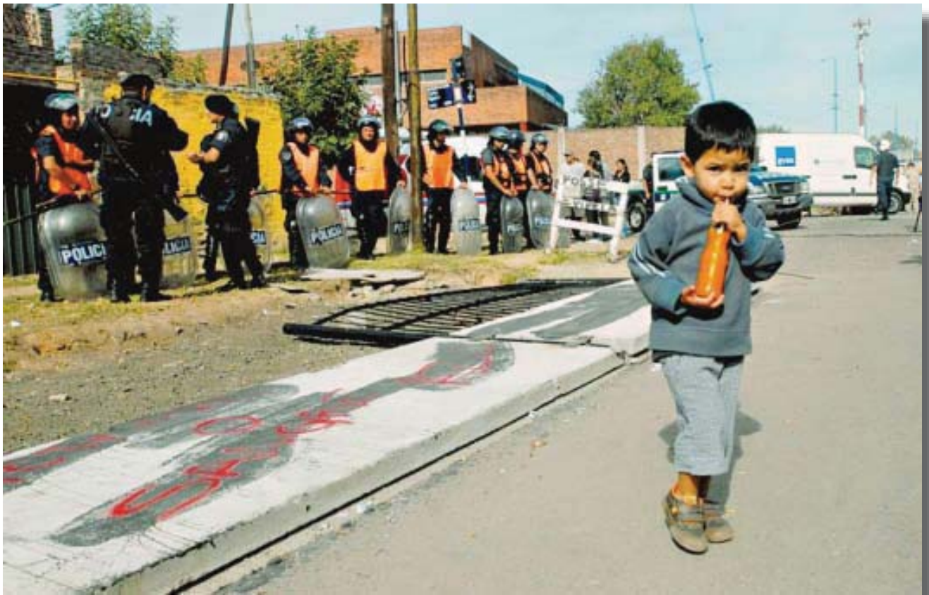
La polémica de un nuevo muro separatista surge en Buenos Aires, donde la presunción radica en la necesidad de proteger a un barrio residencial lujoso de San Isidro de la supuesta hostilidad de los habitantes de San Fernando. (www.plataformaurbana.cl)

En ambos casos se puede concebir al miedo como aquellos sentimientos que se desprenden y se hacen presentes al “aventurarse en lo desconocido, que puede, sin duda causar un mal (...) incluso el amor puede temerse. Es imposible, pues, hacer un repertorio de desencadenantes del miedo si hasta el hilo que sale de una colcha puede serlo. No obstante, en el diccionario están mencionados muchos desencadenantes: la soledad, la barbarie, las catástrofes, el chantaje, la crueldad, el daño, lo imprevisto, los desastres, lo desconocido, la desdicha, la desgracia, el encarnizamiento, el horror, lo ignoto, lo incierto, la inclemencia, lo inesperado, el infortunio, lo inhumano, la inmisericordia, la inseguridad, la intimidación, la mala suerte, la mala ventura, la maldad, la maldición, lo maravilloso, la monstruosidad, la perversidad, la porquería, la probabilidad, lo prodigioso, lo repentino, lo raro, el sadismo, el salvajismo, lo secreto, lo sobrenatural, lo súbito, la suciedad, lo terrible, la violencia” (Marina, 2005: 244-245)