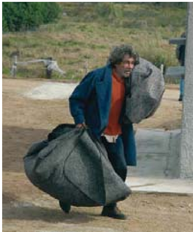
Indigente, cuya presencia marca e incentiva el miedo en la configuración de los espacios sociales consolidados.

de la vida cotidiana, como sentencia y columna de identidad, sentimiento que es muy difícil de evacuar, disminuir y de evitar,