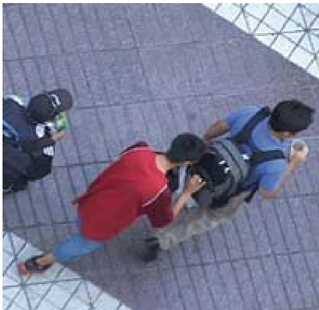
Actos delictuales que se precisan mantener fuera de los espacios sociales ciudadanos reconocibles e inmediatos y que “justificarían” los encierros inmobiliarios.

Este miedo que de manera natural forma parte del ser humano, continúa haciéndose presente en los distintos ámbitos en que se desenvuelve, es decir, no lo abandona en su cotidiana interacción y convivencia con el mundo y su gente, en “La manera de movernos en las calles, entre muchos hombres, en restaurantes, en ferrocarriles y autobuses, está dictada por este temor” (Canetti, 1987: 9) sentimiento que invade y estruja, al grado de establecer límites y dispositivos de seguridad entre su persona y el entorno que lo rodea, a fin de evitar entrar en contacto con todo aquello que lo amenace, o con todas aquellas manifestaciones de violencia que le dañen o provoquen ansiedad, incertidumbre o desequilibre sus estados emocionales.