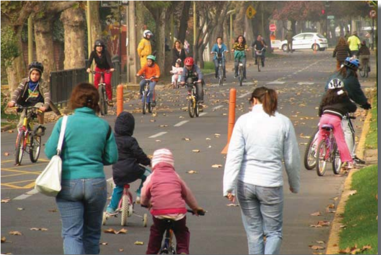
CicloRecreoVía Las Condes, cuya extensión de 2,6 kilómetros de calles libres de vehículos, constituye un espacio urbano que ha tendido a mejorar fuertemente la calidad de vida de los ciudadanos de la comuna, lo que permite afianzar la confiabilidad en estas medidas experimentales.

fraestructura y equipamiento, y altos niveles de inseguridad, que contrastan con municipios en los que proliferan los desarrollos residenciales destinados a grupos sociales de altas rentas y que ofrecen amplios estándares de servicios e infraestructura. Tal vez los casos más emblemáticos de esta dicotomía son los municipios de Valle de Chalco en la periferia oriente de la Zona Metropolitana de la Ciudad de México y Metepec en el valle de Toluca, respectivamente.