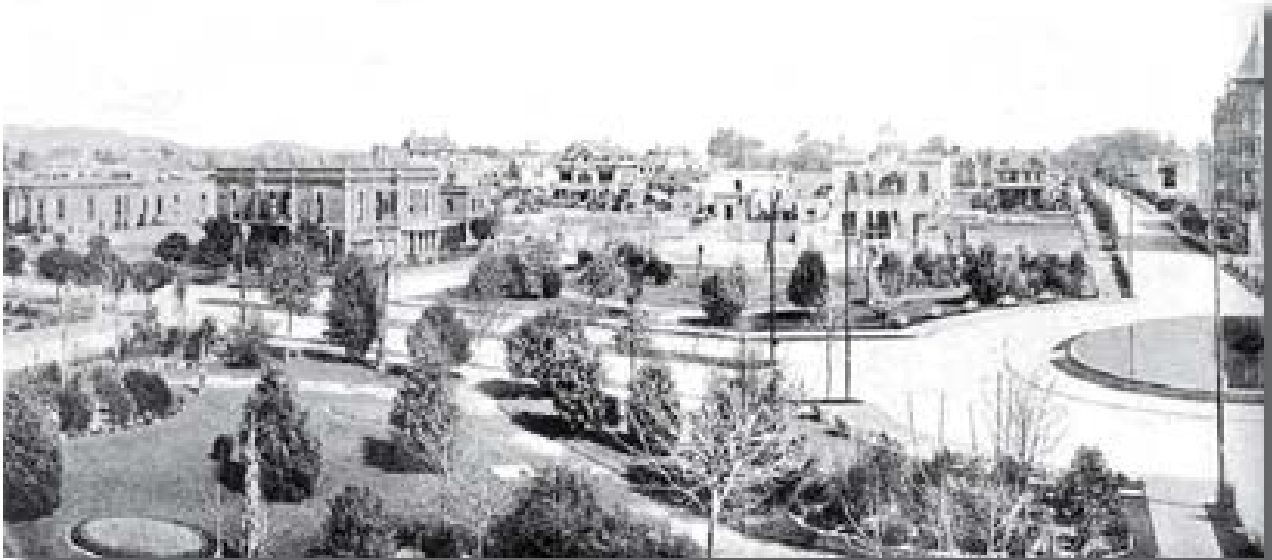
Plaza Río de Janeiro, Colonia Roma, ciudad de México (1908 ca.), si bien con una clara diferenciación social, este espacio público era visto como punto de interacción pluriclasista y de socialización urbana.

Cabe aclarar que dentro de los dispositivos de seguridad empleados por los sectores bajos de población, se encuentran los cristales rotos pegados con cemento en las orillas de las bardas, el empleo de rejas en casas habitación y en pequeños establecimientos, así como para proteger sus autos de los ladrones, éstos son encerrados por estructuras metálicas o enrejados en las vías públicas, el uso de bloques de cemento a fin de limitar el acceso a vehículos de los mismos residentes, la presencia de anuncios dando a conocer los nombres de empresas y dispositivos de seguridad, con el propósito de ahuyentar al ladrón, delincuente o personas ajenas a sus espacios.