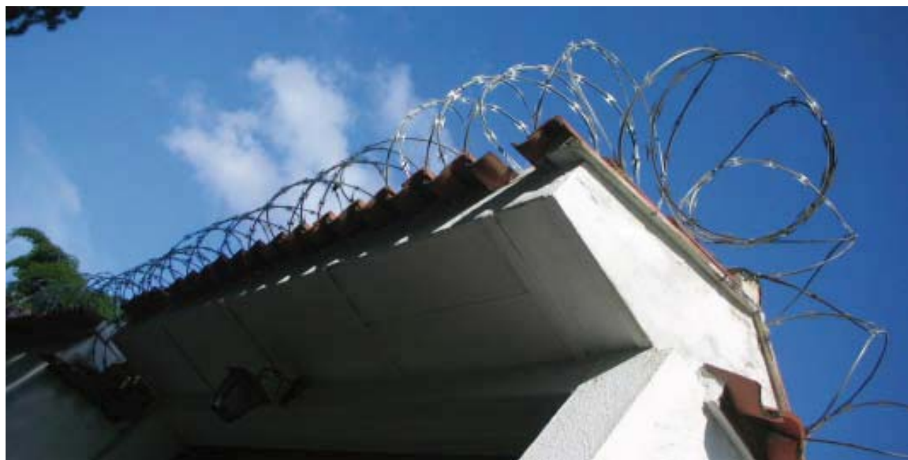
Espacio cerrado con fuertes dispositivos de seguridad físicos y electrónicos, verdaderos bunkers urbanos, actuales símbolos de protección ciudadana, que “agreden” y distancian la ciudad exterior.

Nada teme más el hombre que ser tocado por lo desconocido, con esta afirmación inicia la discusión Elías Canetti, (1987: 9) en su texto Masa y poder , y continúa diciendo que el hombre elude siempre el contacto con lo extraño y que “Todas las distancias que el hombre ha creado a su alrededor han surgido de este temor a ser tocado. Uno se encierra en casas a las que nadie debe entrar y sólo dentro de ellas se siente medianamente seguro. El miedo al ladrón se configura no sólo como un temor a la rapiña sino también como un temor a ser tocado por algún repentino e inesperado ataque procedente de las tinieblas” (Canetti, 1987: 9)