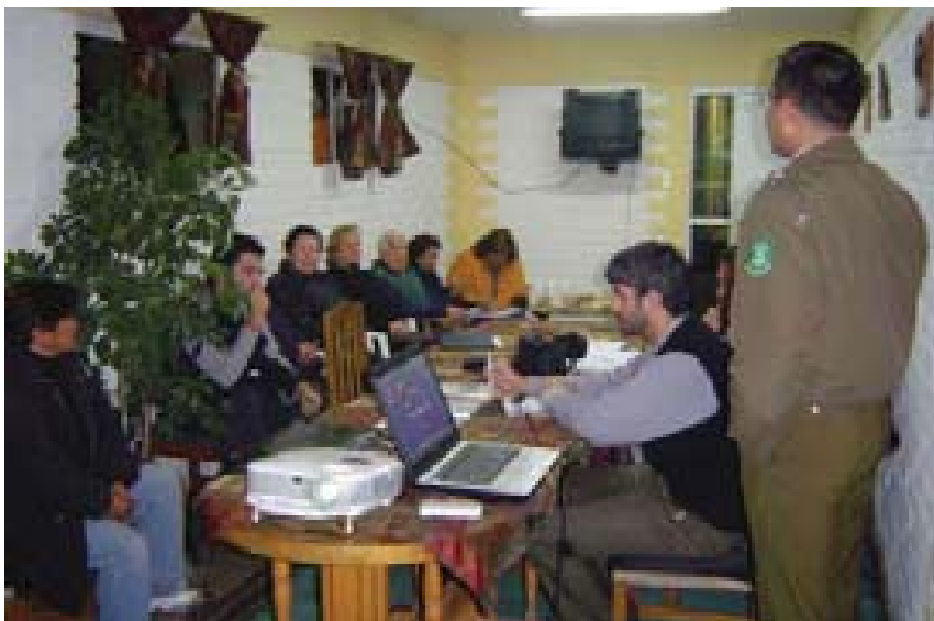
Mesas Territoriales del Programa de Seguridad Pública del Ministerio del Interior, llamado Plan Comunal de Seguridad Pública ex Plan Comuna Segura, Santiago de Chile.