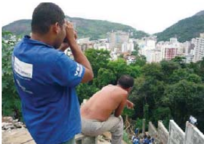
El muro de la miseria ya divide Río de Janeiro. En el acceso principal a la favela Morro Dona Marta, enclavada en un precioso cerro del barrio carioca de Botafogo.

“El miedo entonces es una omnipresencia, está en todas partes, acelera sus latidos cuando menos se lo espera, imposible emanciparse de éste, ni el tiempo, ni la historia lo permiten, pues el miedo está ahí porque nos constituye, es natural –expresa Jean Delumeau–, y se lleva” (Nieto, 2005: 87) “haya o no más sensibilidad ante el miedo en nuestro tiempo, éste es un componente mayor de la experiencia humana, a pesar de los esfuerzos intentados por superarlo (...) Está con nosotros (...) nos acompaña durante toda nuestra existencia” (Delumeau, 1989: 21) “es una pasión como señala Aristóteles que ha estado de nuestro lado” (Nieto, 2005: 87)