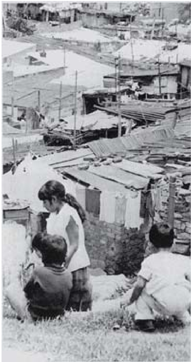
Ciudad perdida "La Marranera", México D.F. (1970).

en el que coexistían e interactuaban los distintos grupos y clases sociales de la ciudad pre y post republicana.