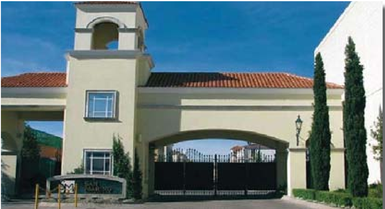
Desarrollo habitacional amurallado "San Marino", Metepec, estado de México (2008)

KEYS WORDS: Fear, Privatization of spaces public, Security disposition