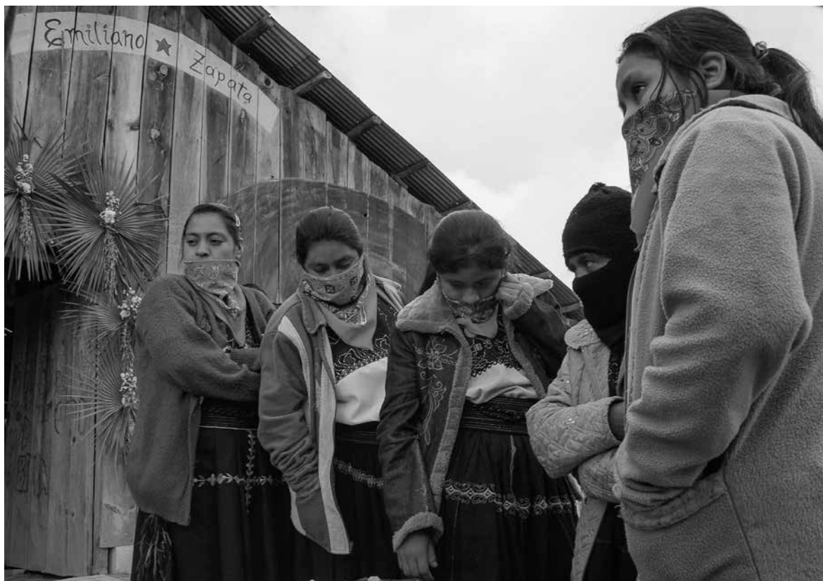
Aniversario del surgimiento público del EZLN, Oventik, Chiapas, fin de año de 2008.

El texto se inicia con una reflexión sobre el papel de las narrativas literarias en la formación de iconos —condensaciones simbólicas de sentido social—. Esto sirve de marco para comprender la transformación de Guido Fawkes en un personaje de novela gráfica y fílmica con el nombre de V. Después se examinan los posicionamientos políticos de V con el fin de explorar los elementos que dan testimonio de su conciencia icónica para rastrear su asimilación en los movimientos sociales