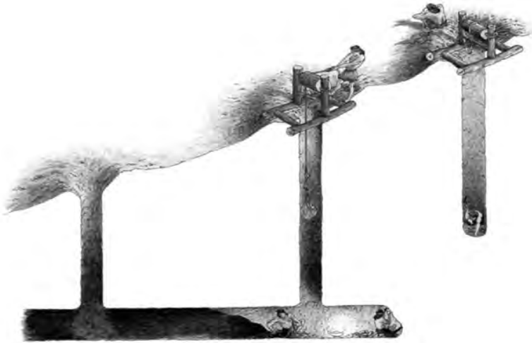
Imagen I Representación general de la construcción de la galería filtrante en el Viejo Mundo