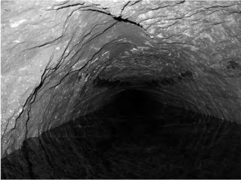
Vista interior de la galería.