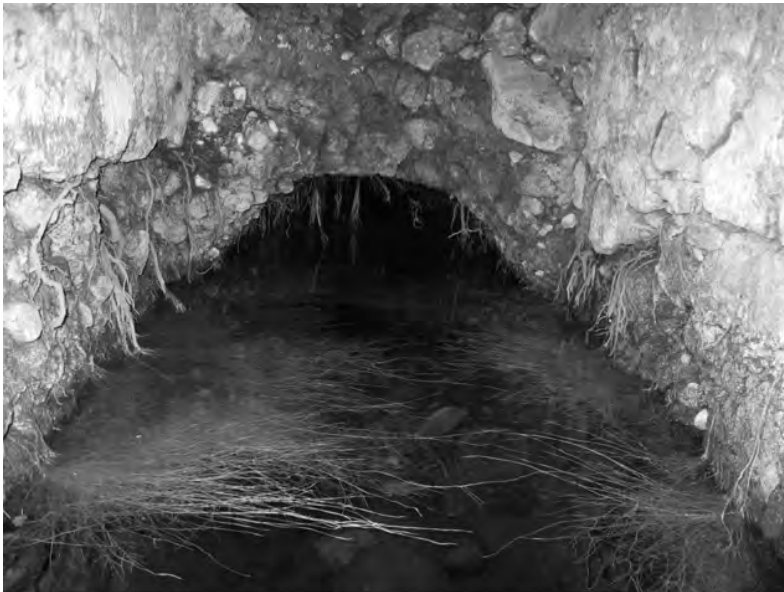
Representantes del Comité de Agua de Tepexoyuca, Ocoyoacac, muestran la galería filtrante denominada El Túnel o El Aventurero.