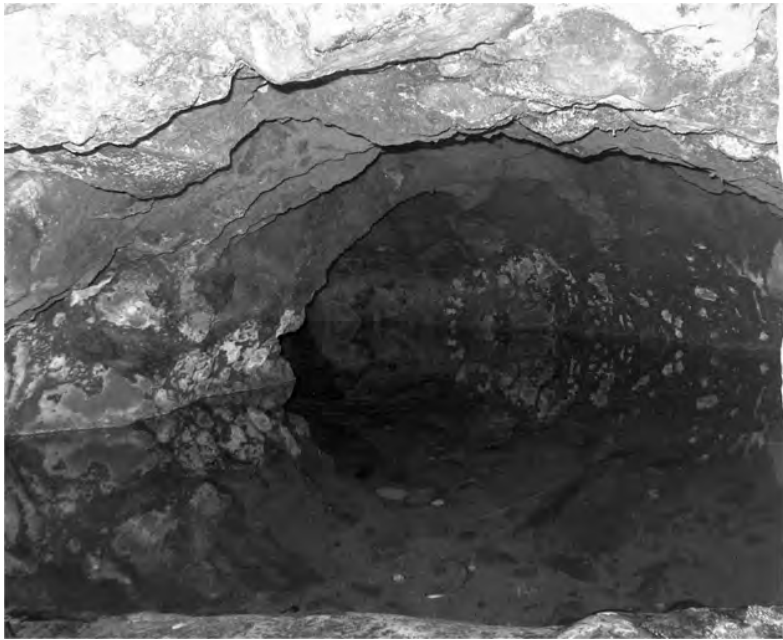
Vistas de la galería filtrante de El Salto.