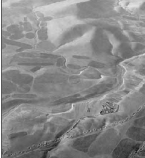
Imagen II Representación general del uso de las galerías filtrantes en el Viejo Mundo