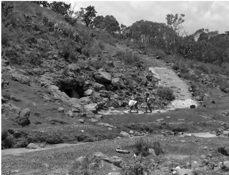
Usuarios que acuden a esta galería filtrante.