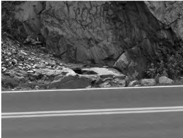
Al pie de la carretera se muestra el paraje La Herradura.

Como se observa en las fotografías siguientes, la galería denominada Ojo de Agua en el paraje La Herradura, es un sistema que tiene sólo una excavación horizontal. Su uso es público y hasta la fecha no se le ha dado mantenimiento alguno.