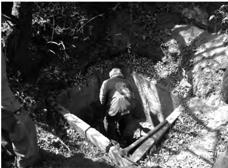
El fontanero quita la tapa del registro de la entrada a la galería filtrante del Túnel de Romero.

Los dos fontaneros se encargan de revisar el sistema, distribuir el agua, colocar nuevas tomas y el mantenimiento de los canales. Ellos son quienes tienen mayor conocimiento del sistema, dónde se ubican los manantiales, el tendido de toda la red de agua, válvulas y horarios de la distribución del líquido; también se encargan del mantenimiento y tienen un salario.