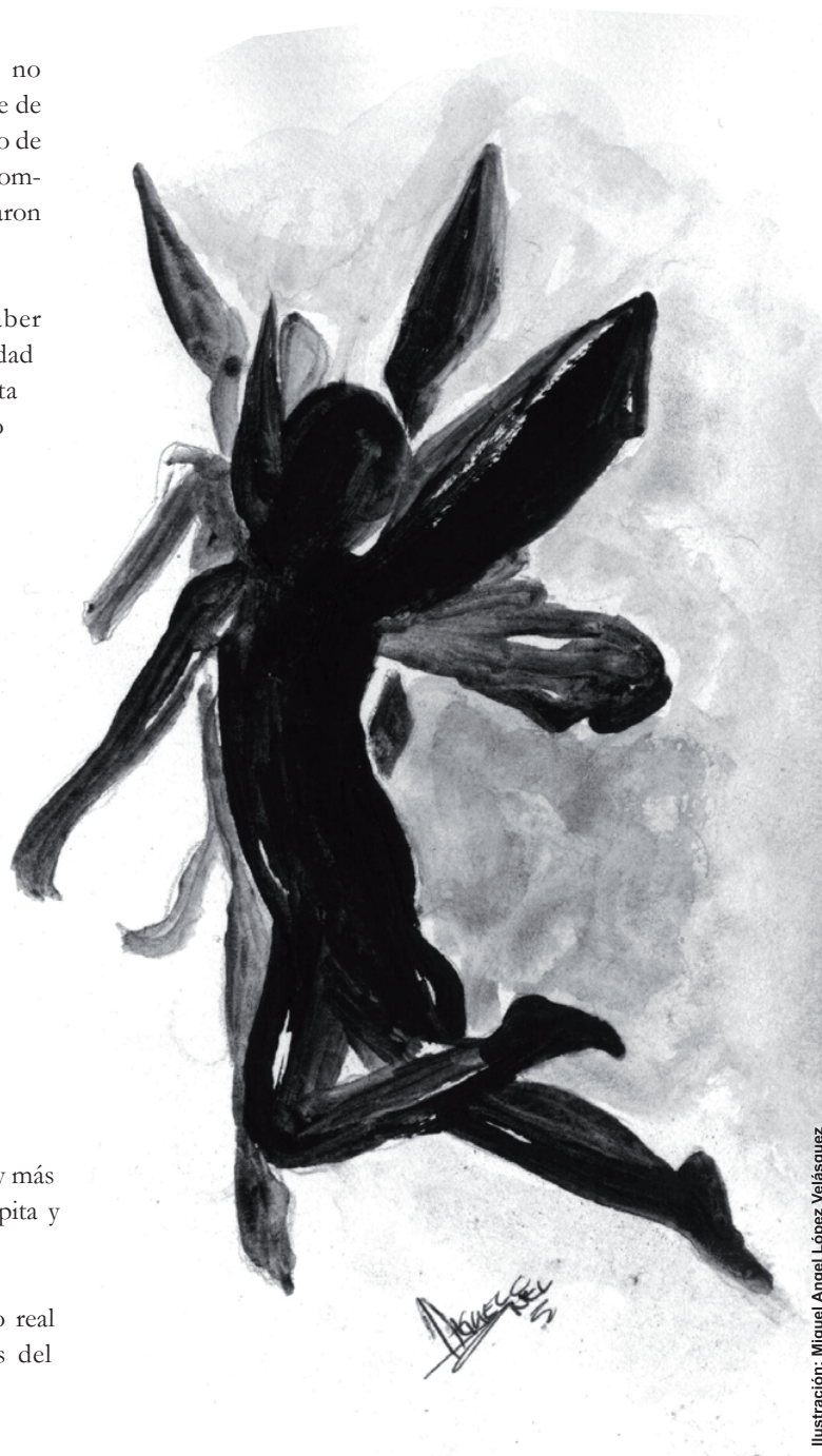
Ilustración: Miguel Ángel López Velásquez

Del destino nadie se escapa. Y si lograste escapar, es que no fue tu destino.