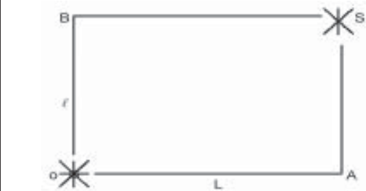
Figura 2. Trayectorias de neutrones en un interferómetro.

Pensemos en dos partículas (neutrones térmicos) que salen de una fuente (O), por dos trayectorias diferentes y llegan a un mismo detector (S). La partícula (1) seguirá una trayectoria horizontal con longitud L partiendo del origen (O), hacia un punto que llamaremos (A), después se dirige hacia el detector (S) tomando una trayectoria vertical con longitud \ell con respecto al anterior camino, obteniendo una trayectoria del OAS, y por otro lado la partícula (2) recorrerá la trayectoria vertical del origen (O) al punto B con longitud \ell , para después llegar al detector (S) construyendo así la trayectoria OBS, como se puede ver en la figura 2.