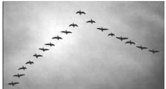
La estructura delta coherente de las aves emigrantes nos recuerda también a los solitones. En efecto, aquí hay una conjunción cooperativa de esfuerzos entre las aves débiles y fuertes para viajar a grandes distancias.

La pérdida de información en fibras ópticas se debe a varios fenómenos físicos, como se mencionó, y depende también de la longitud de onda de la luz. Comúnmente las pérdidas ocurren debido a la absorción; y para entender estas pérdidas, es necesario indagar cómo las ondas de luz interactúan con la materia.