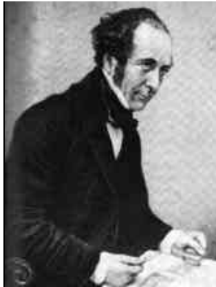
John Scott Russell

Correo electrónico: lcecilianoh@yahoo.com.mx