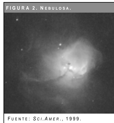
FIGURA 2. NEBULOSA.

Cuando una supernova explota, los núcleos sufren transformaciones y lanzan al rededor las otras partículas (protones y neutrinos), estas partículas se unen a los átomos de la capa exterior de la estrella y forman núcleos más pe-