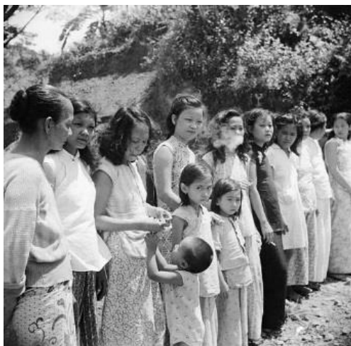
Mujeres y niñas de origen chino y malayo esclavizadas por los japoneses en Penang durante 1945.