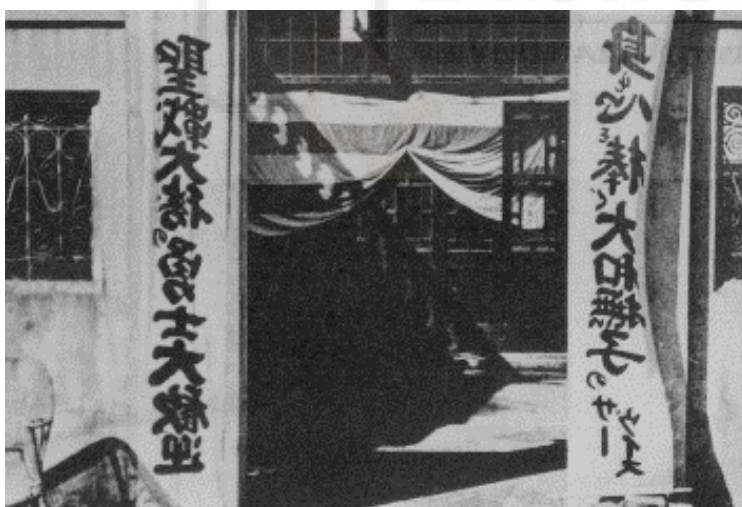
Entrada de uno de los burdeles donde ejercían la prostitución contra su voluntad las "mujeres de confort".