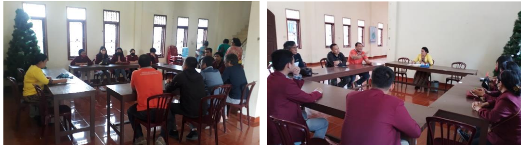
Gambar 3. Operator gereja peserta pelatihan pengguna Sistem

Berdasarkan pengamatan pemateri selama kegiatan pengabdian masyarakat ini, para peserta pelatihan umumnya sudah cukup memahami operasional penggunaan komputer. Operator klasis gereja memiliki cukup pengetahuan dasar tentang teknologi informasi berbentuk aplikasi website dikarenakan para peserta pelatihan berada dalam rentang usia muda yang sudah terbiasa dengan penggunaan teknologi digital. Hanya saja pada proses pelaksanaan untuk penyimpanan/penginputan data jemaat masih sedikit kurang memahami karena proses yang selama ini masu dilakukan manual dengan pencatatan pada buku induk dan arsip berkas. Beberapa peserta pelatihan juga menyampaikan terkait lokasi kerja operator gereja yang berda di wilayah tertentu dimana terkendala dengan kualitas jaringan komunikasi komputer (internet) yang terkadang tidak baik.