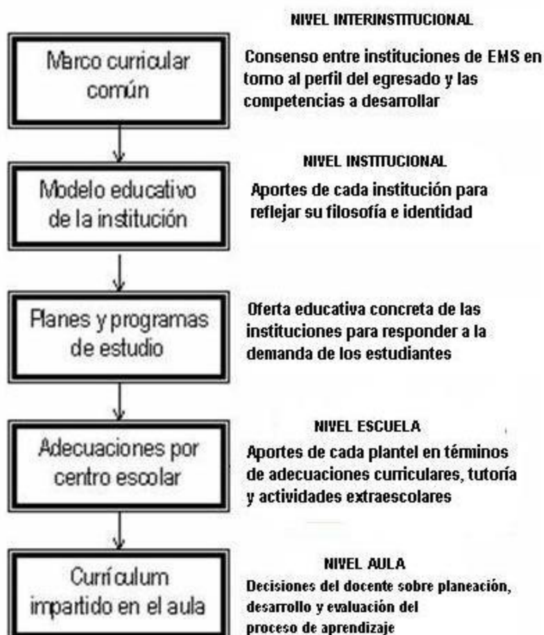
Grafico 2: Niveles de Concreción

El siguiente cuadro muestra los cinco niveles de concreción donde se han operado los cambios requeridos por esta reforma, muchos de ellos dependen a nivel macro de los subsistemas y autoridades educativas, otros (los más evidentes) se darán a nivel de subsistemas y en las aulas, de acuerdo a la oferta educativa que se ofrezca en cada uno.