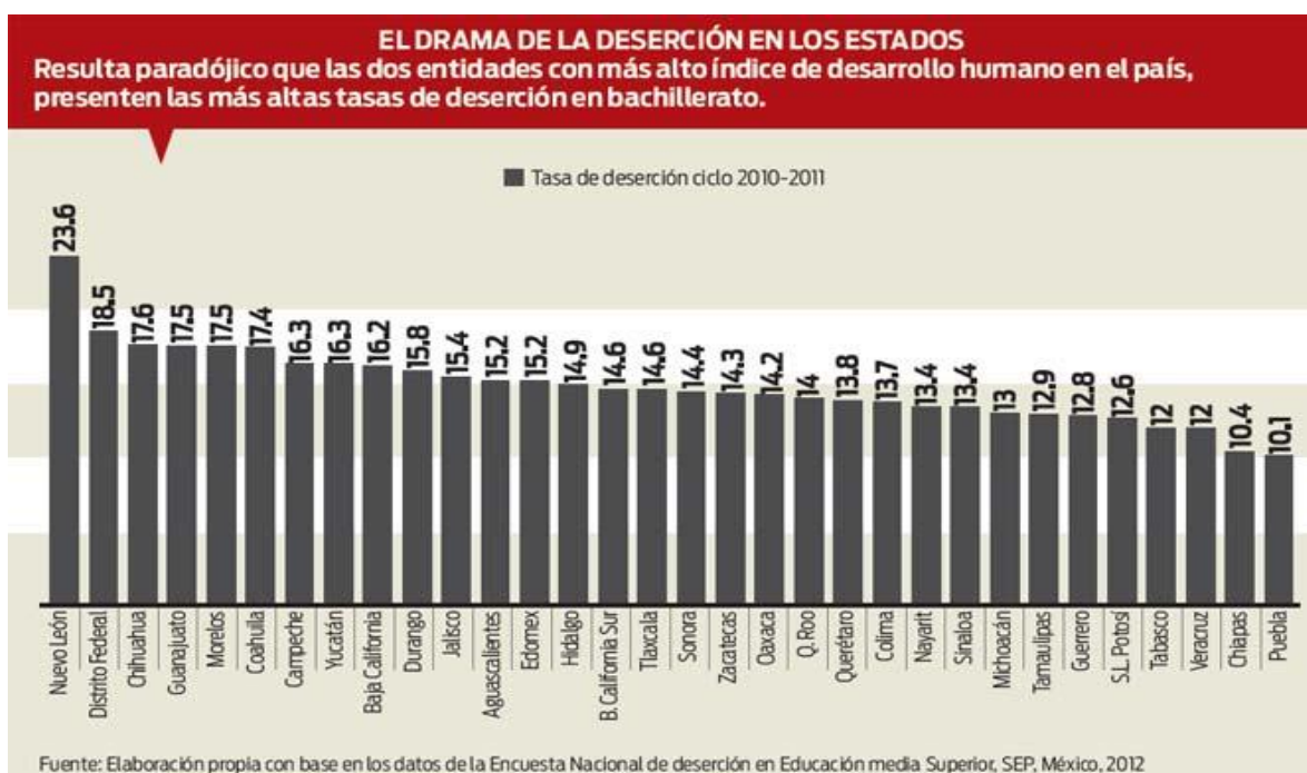
Gráfico 1: Índices de deserción en los estados

El siguiente cuadro nos muestra los índices de deserción, que sigue siendo uno de los problemas más graves que debe combatirse, ya que a etapa de desarrollo en que se ubican la mayor parte de la población que ingresa a a educación media, enfrenta problemáticas particulares, que inciden en estos altos índices de abandono escolar.