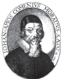
Imagen 2. Retrato de Juan Amos Comenio, 1592-1670. (COMENIO, Orbis Sensualium Pictus, 1993)