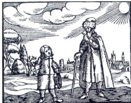
Imagen 4. Edición facsimilar de la invitación del Orbis Sensualis Pictus de Juan Amos Comenio

En el capítulo primero, el acto formal con el que inicia su enseñanza representativa es el de invitar al discípulo a ser sabio, es una invitación expresa a la sabiduría, pero ¿qué es ser sabio? Ser sabio es entender y hacer y expresar correctamente lo que es necesario (Comenio, 1993: 79).