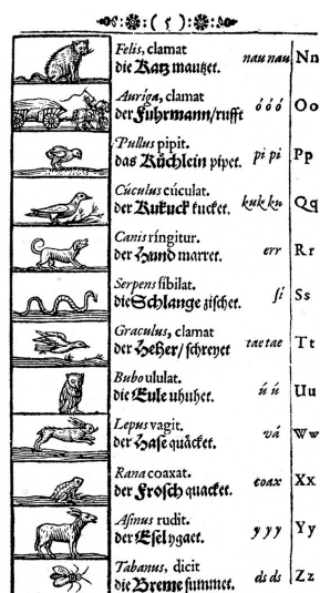
Imagen 3. Edición facsimilar del alfabeto del Orbis Sensualis Pictus de Juan Amos Comenio. (COMENIO, Orbis Sensualium Pictus, 1993, pág. 81)

En el capítulo primero, el acto formal con el que inicia su enseñanza representativa es el de invitar al discípulo a ser sabio, es una invitación expresa a la sabiduría, pero ¿qué es ser sabio? Ser sabio es entender y hacer y expresar correctamente lo que es necesario (Comenio, 1993: 79).