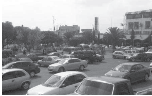
Figura 1. Afluencia vehicular en el Centro Histórico de Zumpango