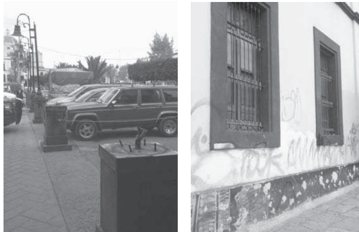
Figura 3. Condiciones de deterioro de luminarias y grafiti en fachadas del Centro Histórico

Los principales obstáculos mencionados por los entrevistados dentro de la Plaza Juárez fueron la presencia de comercio informal y la aglomeración de personas en determinadas horas del día (salida y entrada de estudiantes principalmente). Un problema percibido de manera generalizada por los peatones del Centro Histórico es la basura que no sólo da un mal aspecto, sino también produce malos olores y da pie a la generación de fauna nociva (uno de los entrevistados menciona haber visto ratones en las jardineras de la Plaza). Durante la observación de campo se pudo constatar que una gran parte de los residuos en la vía pública proviene de los productos ofrecidos por los puestos ambulantes (principalmente alimentos), así como la insuficiencia y ubicación de los contenedores de basura, lo cual orilla a que ésta sea depositada –inadecuadamente– en otros sitios.