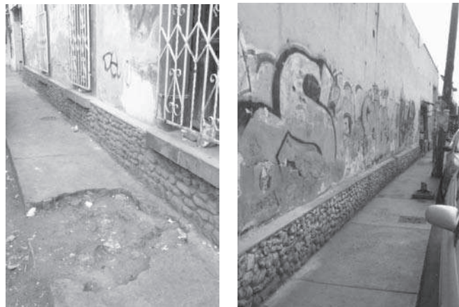
Figura 2. Condiciones deterioradas de la banqueta y obstáculos para transitar en tramo de la calle Jesús Carranza

Otra problemática señalada por los entrevistados fueron las condiciones de deterioro en que se encuentran las banquetas en algunas secciones del Centro Histórico (figura 2), así como la mala ubicación de teléfonos públicos y postes, y el tamaño reducido de la mismas no permiten la circulación de dos personas al mismo tiempo, lo cual ha ocasionado que éstas prefieran transitar por la calle, exponiéndose a ser golpeados por algún automóvil y obstaculizando el flujo vehicular.