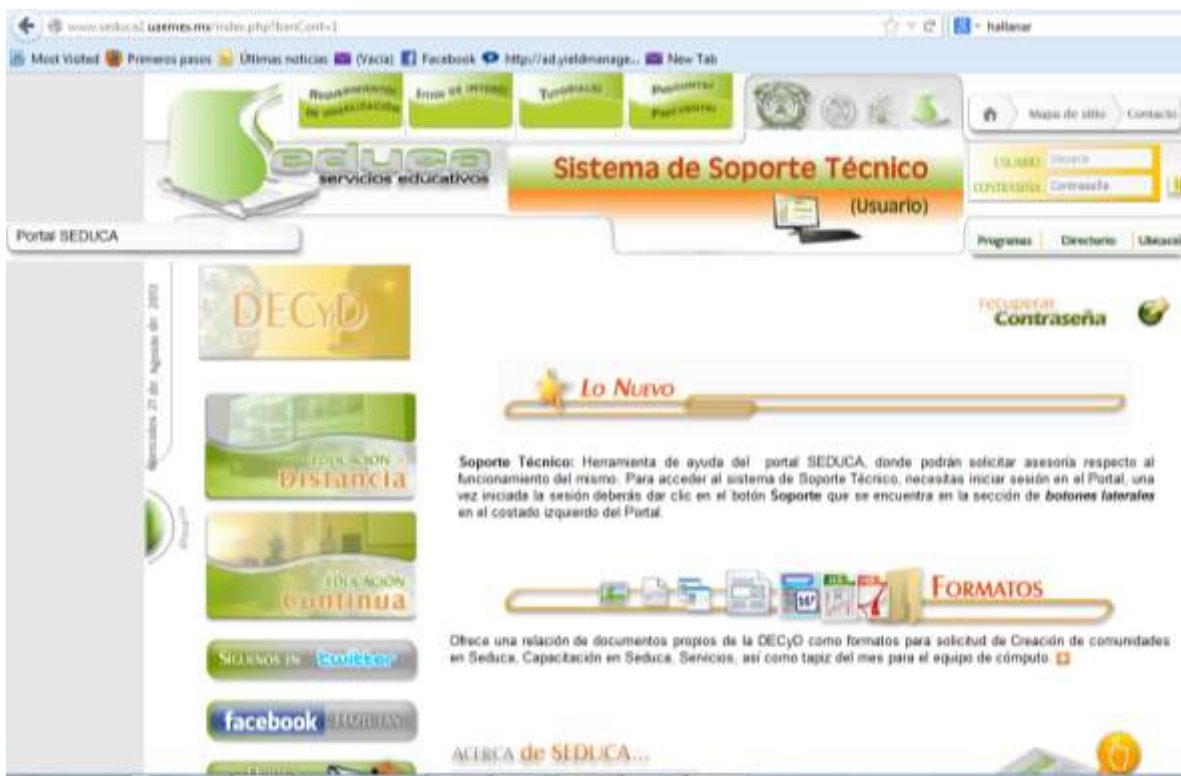
Imagen 2. Portal SEDUCA UAEM 2014.

Después de este ejercicio que entrego resultados importantes para la UAEM, se continuaron con otros desarrollos de otros planes de estudio estos son (se incluirá la primera licenciatura en esta lista):